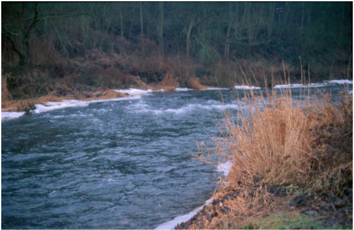
Abb. 4: Laichplatz des Lachses in der Äschenregion der Ahr, einem rheinland-pfälzischen Wiederansiedlungsgewässer