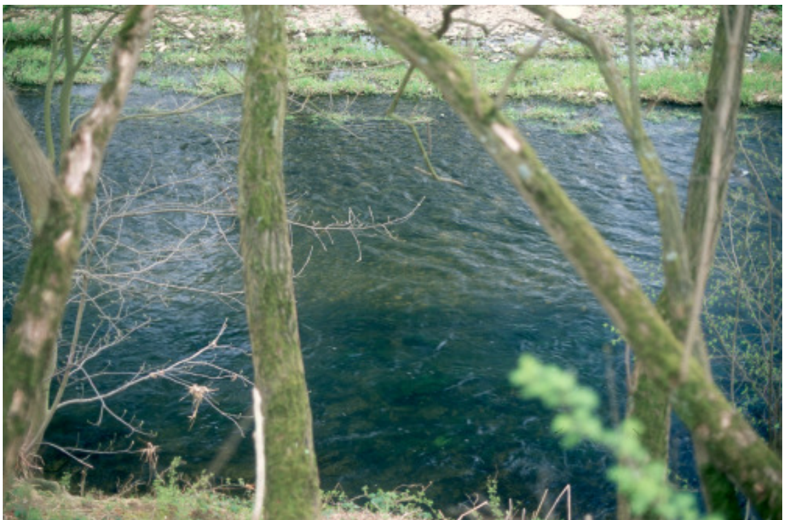
Abb. 5: Lachslaichgrube in der Ahr, erkennbar an der hellen Färbung des Substrates