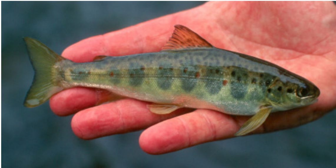
Abb. 1: Jungfisch im zweiten Lebensjahr („Parr“)