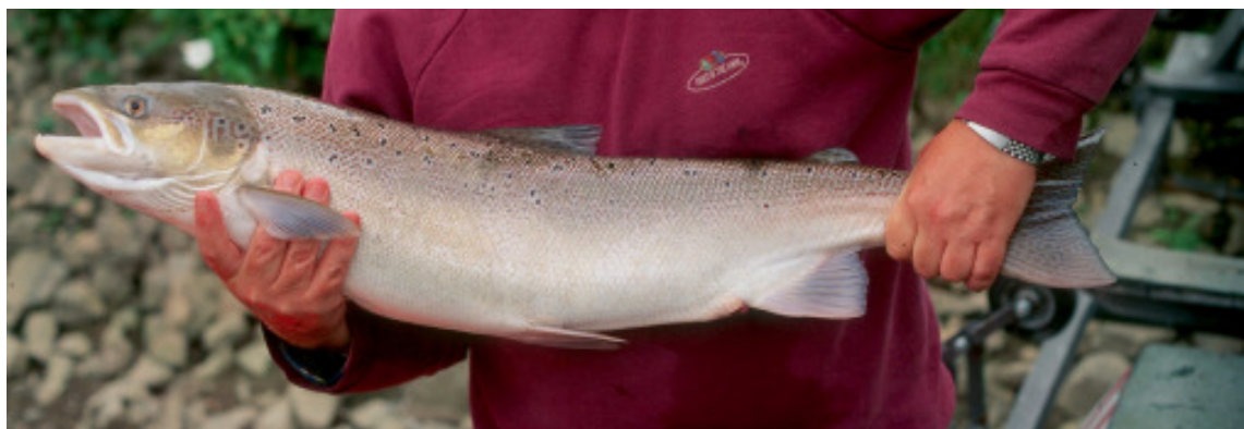
Abb. 3: Lachsrogner, im September 2000 Mündungsbereich der Lahn nachgewiesen