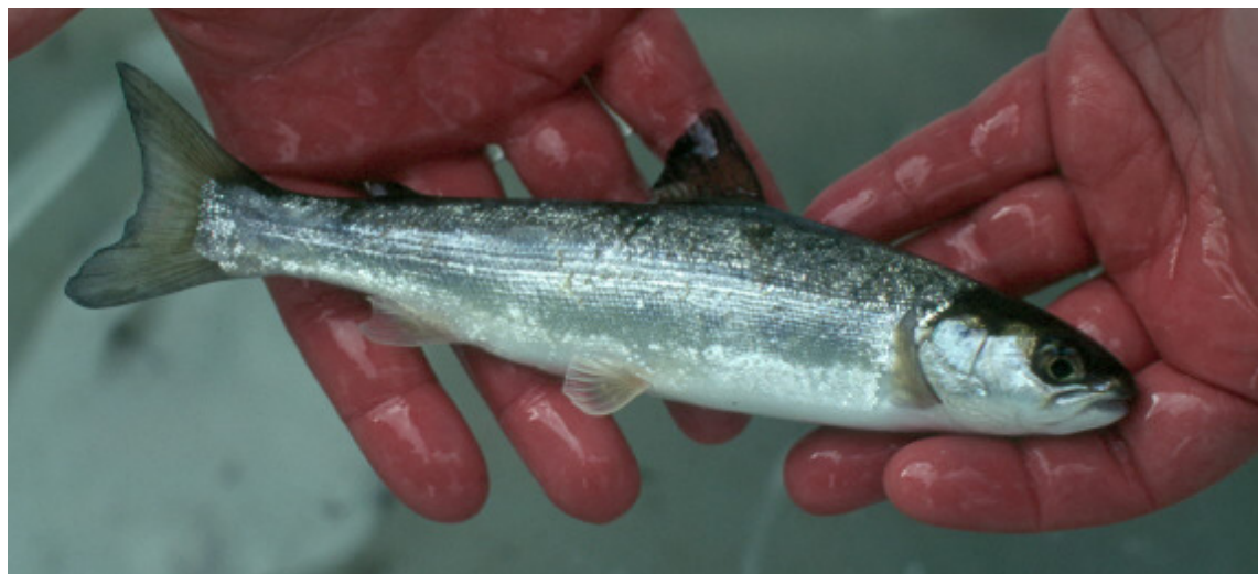
Abb. 2: Zweijähriger Lachssmolt unmittelbar vor der Abwanderung