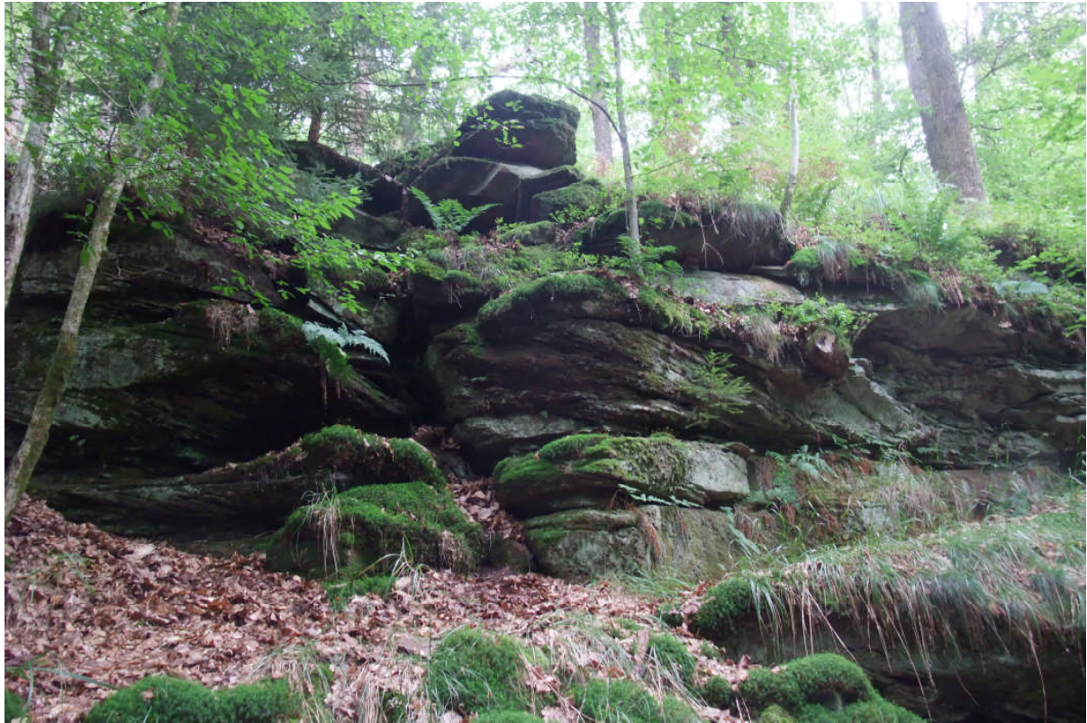
Abb. 2: Typischer Wuchsort von Trichomanes speciosum – ein beschatteter Sandsteinfelsen mit tiefen Spalten. (Foto: M. Kempf 2009).

Titelbild: Gametophyten-Polster von Trichomanes speciosum auf Buntsandstein (Foto: M. Kempf 2010).