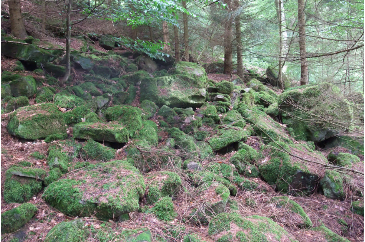
Abb. 3: Auch in beschatteten Blockhalden oder -meeren kommt Trichomanes speciosum vor.