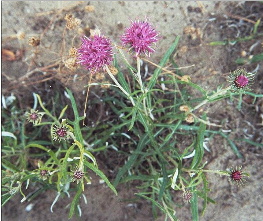
Jurinea cyanooides (L.) Rchb..