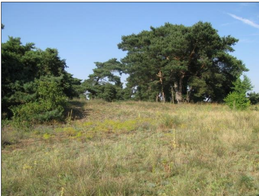
Typischer Lebensraum von Jurinea cyanooides.