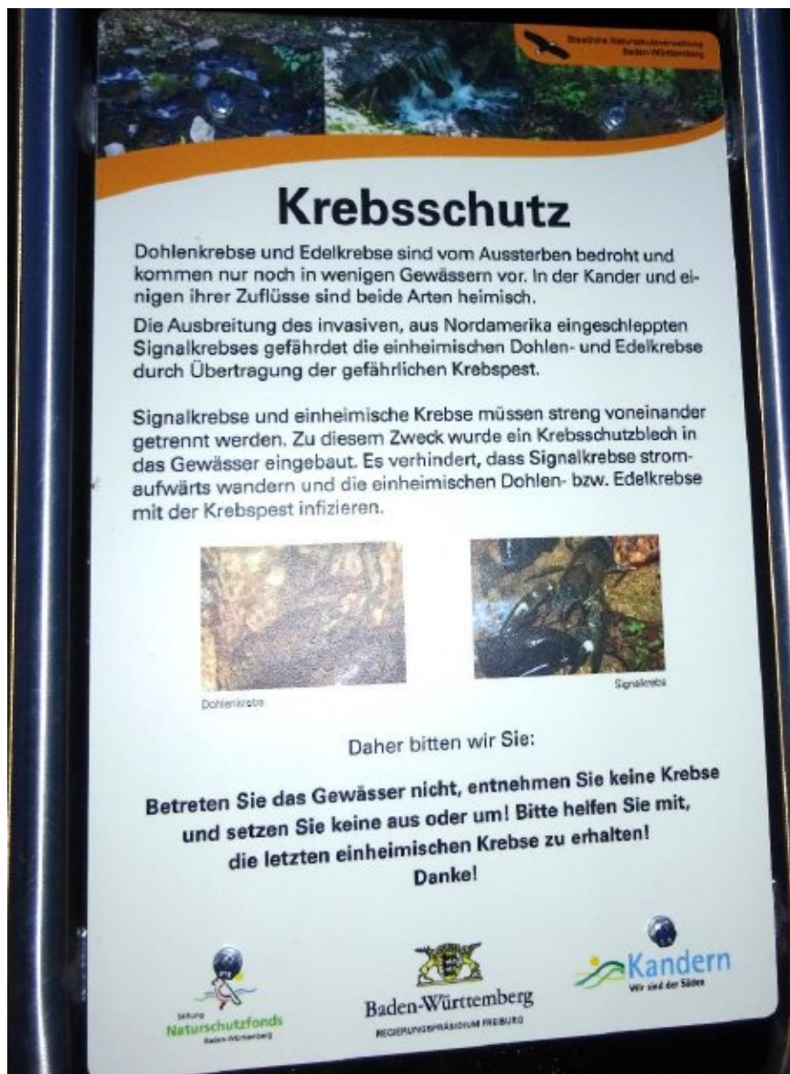
Abbildung 3: Infotafel an einer Krebsperre (Kandern).

An baden-württembergischen Krebsperren-Standorten wurde die Installation der Sperren durch lokale Öffentlichkeitsarbeit begleitet (Behm & Biss, 2016). Dies geschah primär durch Presseartikel, wobei im Einzelfall abgewogen wurde, ob die exakte Lage der Krebsbestände genannt wird. Dort wo Bauwerke öffentlich zugänglich und auffällig sind, wurden zudem Infotafeln angebracht, die über den Zweck der Krebsperre aufklären und die Bevölkerung um Mithilfe bei der Krebspestprävention bitten ( Abbildung 3 ).