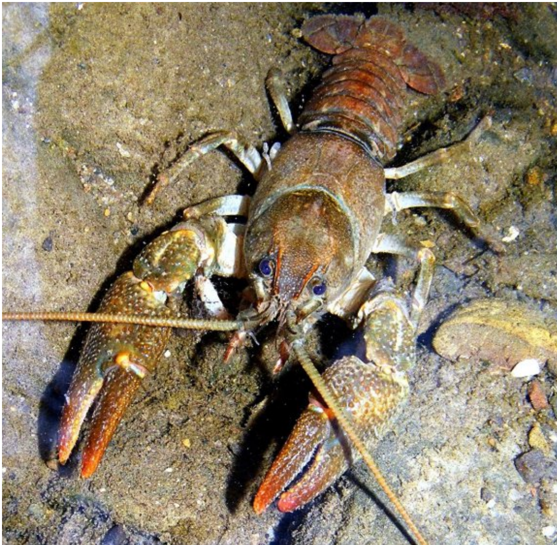
Abbildung 1: Der Steinkrebs ( Austropotamobius torrentium ) ist die kleinste heimische Flusskrebsart – neben Lebensraumverlust und Gewässerverunreinigung ist er besonders durch das Vordringen von invasiven gebietsfremden Arten gefährdet.

(14) Gibt es Erkenntnisse, ob Öffentlichkeitsarbeit, die den Schutz der einheimischen Krebse und die Vermeidung der Einschleppung der Krebspest zum Ziel hat (z.B. Infotafeln an Krebs-Gewässern), auch negative/kontraproduktive Auswirkungen haben kann?