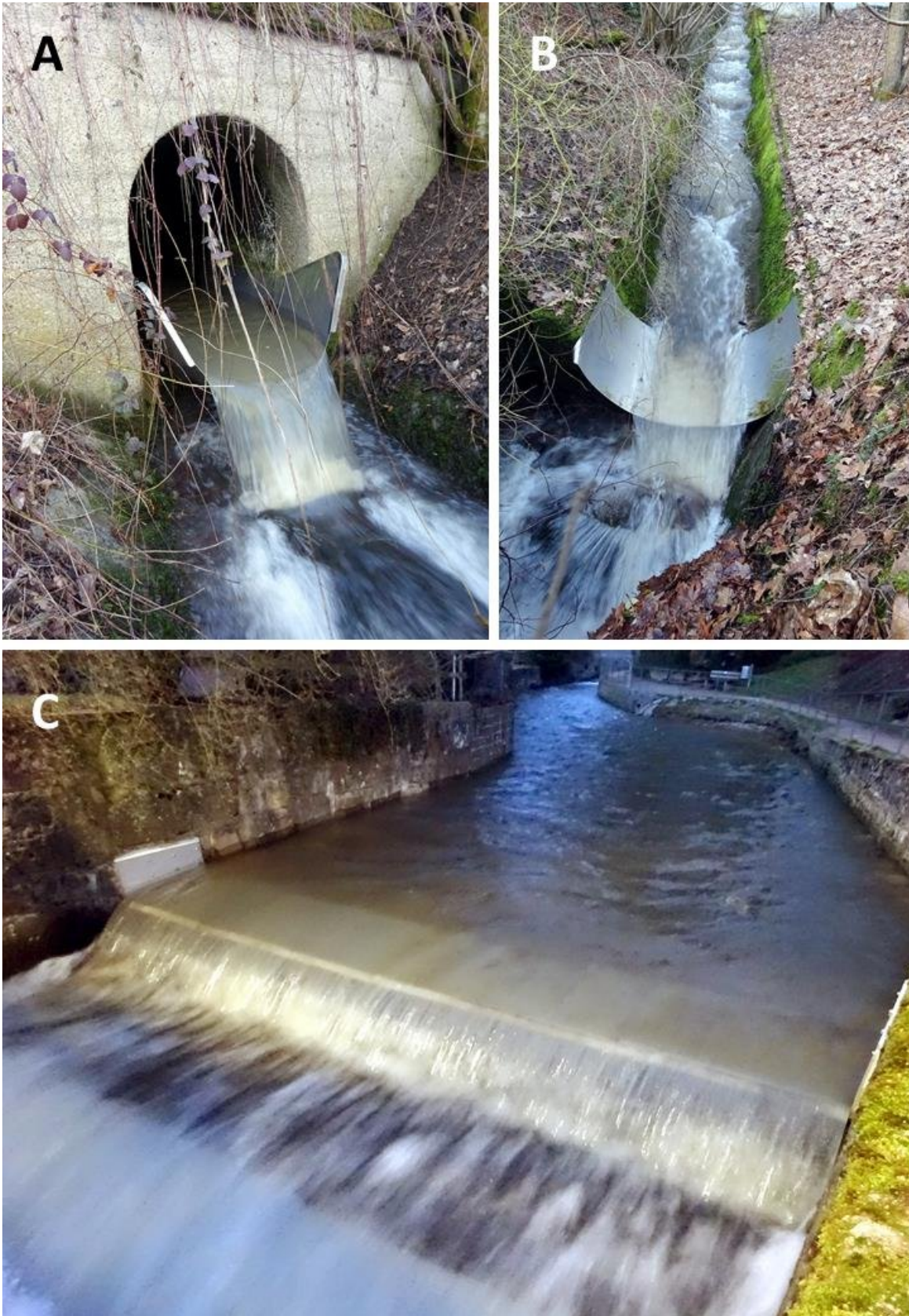
Abbildung 2: Verschiedene Vollsperrn in ad hoc Bauweise (A – Finsterbach, BW; B – Zieggraben, BW; und C – Kander, BW). Die Sperrn wurden jeweils auf vorhandene Strukturen aufgesetzt. Für A wurde der Absturz neu erzeugt.