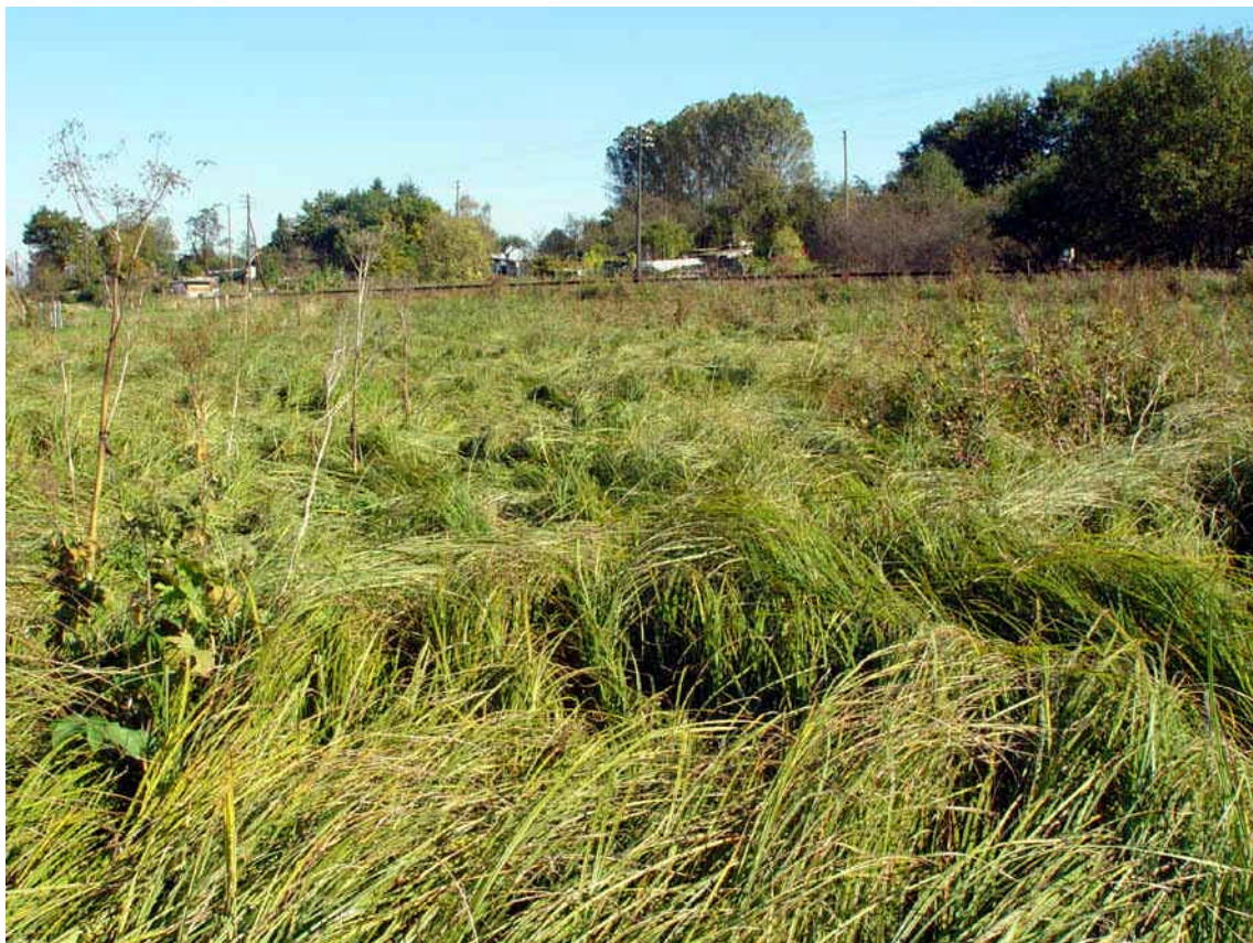
Abbildung 2: Lebensraum von Vertigo angustior , Großseggenried bei Rödgen (Gießen).