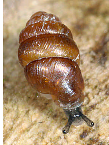
Abbildung 1: Vertigo angustior JEFFREYS 1830. Links nach ADAM (1960), ca. 20-fach vergrößert, rechts Lebendaufnahme