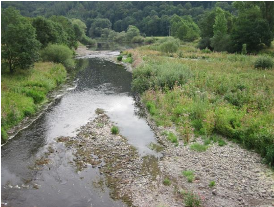
Abbildung 8: Typischer Lebensraum der Bachmuschel – naturnaher Abschnitt der Eder