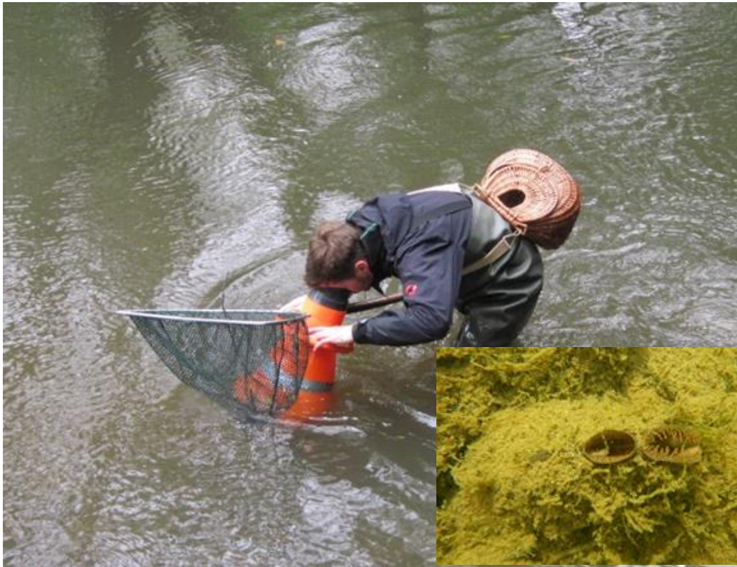
Abbildung 2: Klassische Methode der Muschelerfassung mittels Glasbodenkasten/Aquaskop mit optisch erfassbarer Bachmuschel an der Sedimentoberfläche (kleines Bild) (Aufnahmen: C. Dümpelmann).

Kleinere, flache Gewässer oder die bewatbaren Uferbereiche von Stillgewässern werden mit Wathosen und einem Glasbodenkasten oder –rohr abgesucht. Dabei werden die Muscheln, die in der obersten Sedimentschicht des Gewässers stecken und mit ihren Atemöffnungen aus dem Sediment ragen und somit sichtbar sind, erfasst (vgl. Abbildung 2).