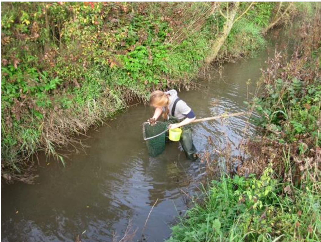
Abbildung 4: Sedimentsiebungen zur Muschelerfassung mittels Muschelkescher.