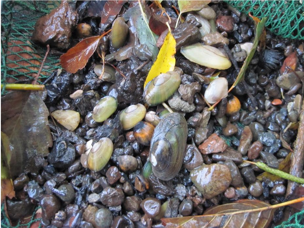
Abbildung 1: Bachmuscheln ( Unio crassus riparius ) verschiedenen Alters aus der Horloff

Die Bachmuschel ist eine Art nach Anhang II der Flora-Fauna-Habitat-Richtlinie 92/43/EWG (FFH). Sie ist nach dem Bundesartenschutzgesetz eine besonders und streng geschützte Art. Gleichzeitig ist sie ein „Fisch im Sinne des Gesetzes“ und der Umgang mit ihr unterliegt auch dem Landesfischereigesetz, welches eine ganzjährige Schonfrist für die Bachmuschel vorsieht, was bedeutet, dass für die Art in Hessen ein ganzjähriges Fang- und Entnahmeverbot gilt.