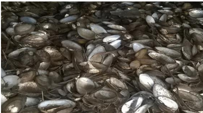
Abbildung 7: Ein großer Bisamfraßplatz im Stadtgebiet von Marburg an der Lahn mit tausenden von Teich- und Malermuschelschalen.

Wie sich im trockenen Sommer 2018 zeigte, ist bei niedrigen Wasserständen der Waschbär an Bachmuschelbeständen in kleineren Gewässern eine ernsthafte Gefahr, da diese Kleinbären alle für sie begehbaren Flachwasserbereiche sehr effizient auf Muscheln absuchen und diese fressen.