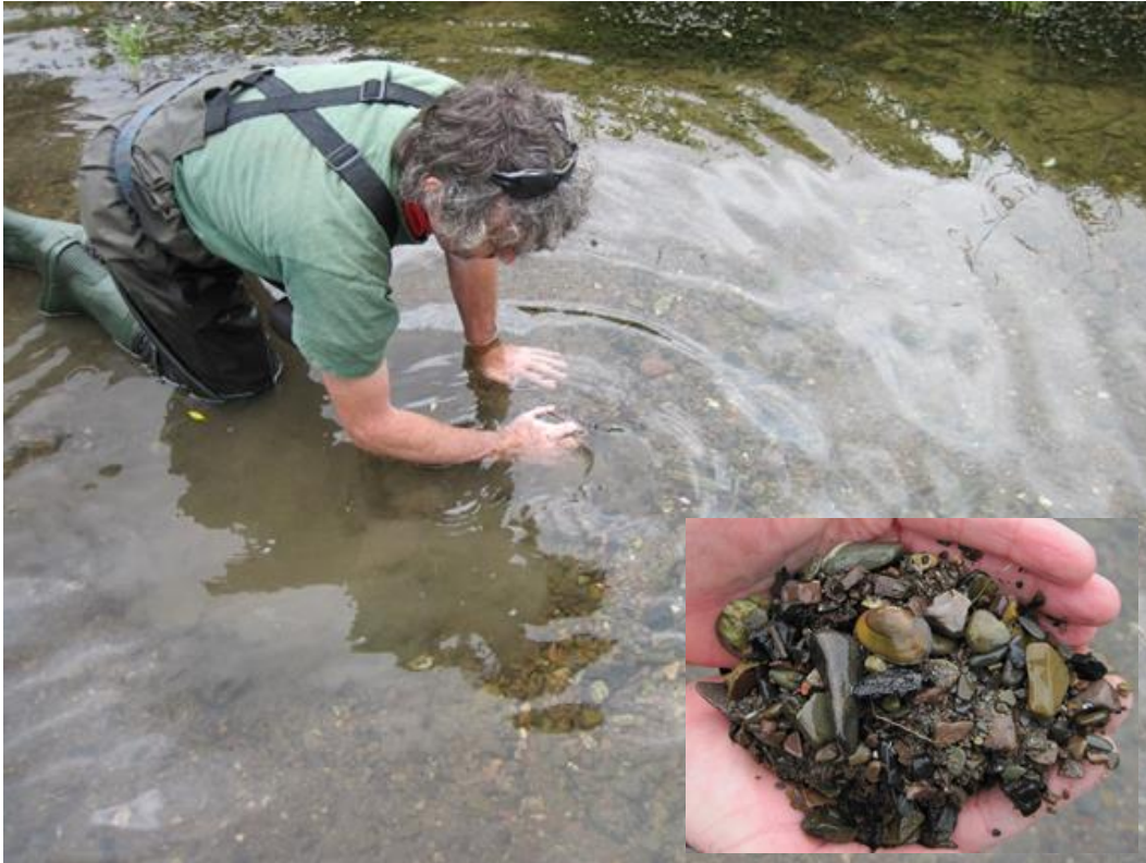
Abbildung 3: Tasten durch die obersten Sedimentschichten als Muschelerfassung mit dadurch nachgewiesene Bachmuschel (kleines Bild).