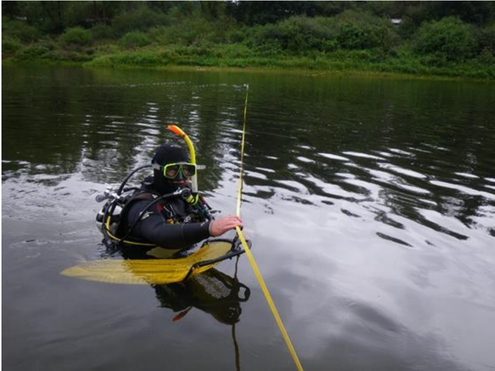
Abbildung 5: Betauchungen sind besonders in tieferen Fließ- und Stillgewässern zur Muschelerfassung geeignet.

Tiefere Gewässer können von Tauchern untersucht (vgl. Abbildung 5) oder mit Bodengreifern oder Dredgen beprobt werden. Die genaue Erfassung der Bestandsgrößen ist in kleineren Gewässern näherungsweise möglich, aber in größeren Gewässern wird es sich stets um Schätzwerte handeln müssen.