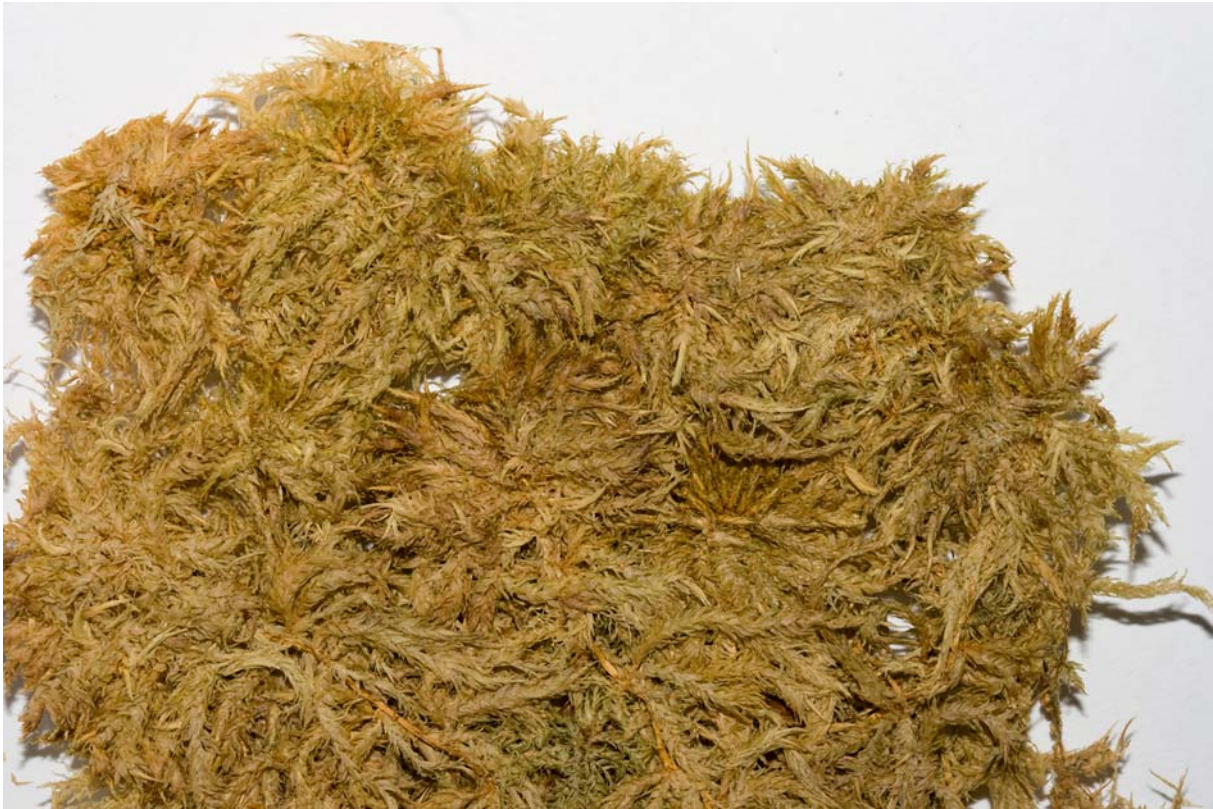
Abb. 1: Sphagnum majus (Herbarbeleg GOET)

Erstellt von U. Drehwald, D. Teuber & T. Wolf (2010)