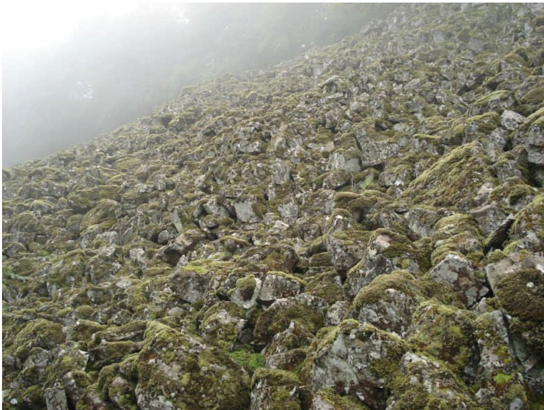
Abb. 2: In den Basaltblockhalden am Hohen Meißner kam in früheren Zeiten Cladonia stellaris vor..