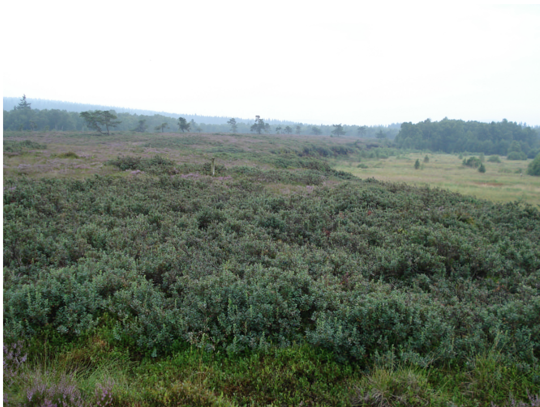
Abb. 3: Cladonia stellaris kam noch bis in die zweite Hälfte des 20. Jahrhunderts im Roten Moor (Hohe Rhön) vor. Seither ist die Art dort nicht mehr beobachtet worden und ausgestorben.