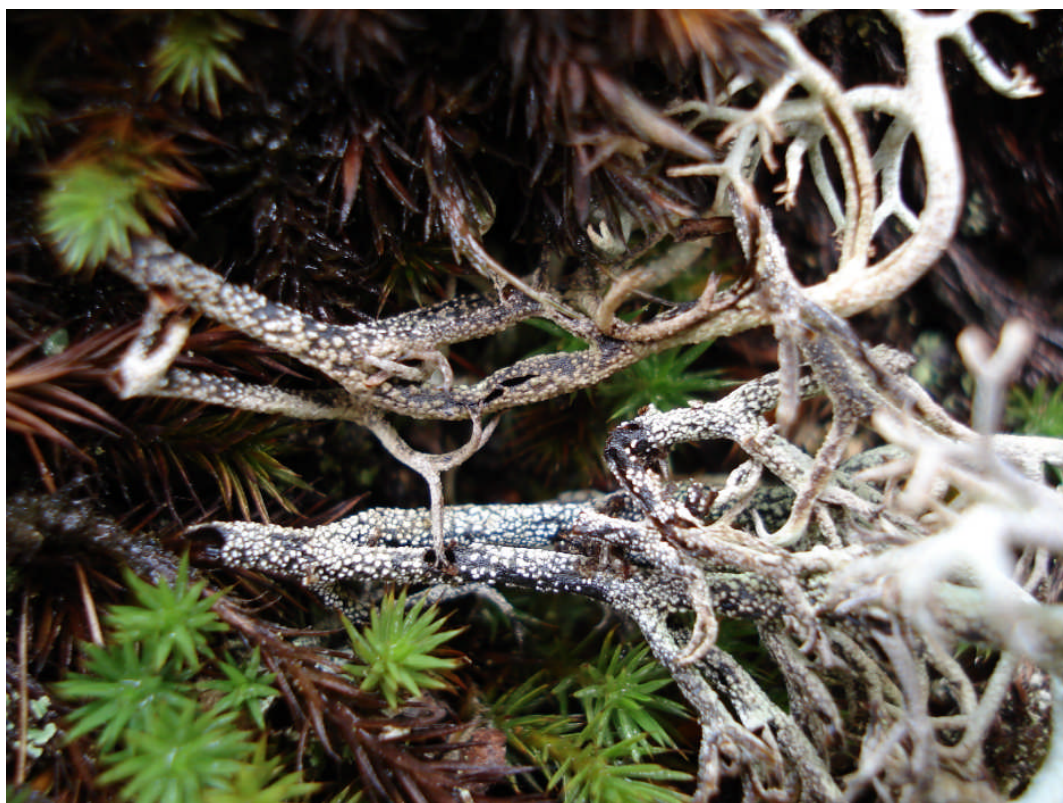
Abb. 3: Ein typisches Merkmal von Cladonia stygia ist das schwarz-weiße „Netzmuster“ an der Basis der Podetien; Rotes Moor in der Hohen Rhön.