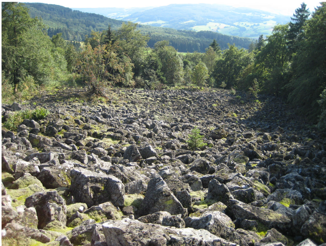
Abb. 2: Ein typischer Lebensraum von Cladonia stygia sind die Basaltblockhalden am Meißner und in der Hohen Rhön, hier am Buchschirmküppel südöstlich von Hilders.