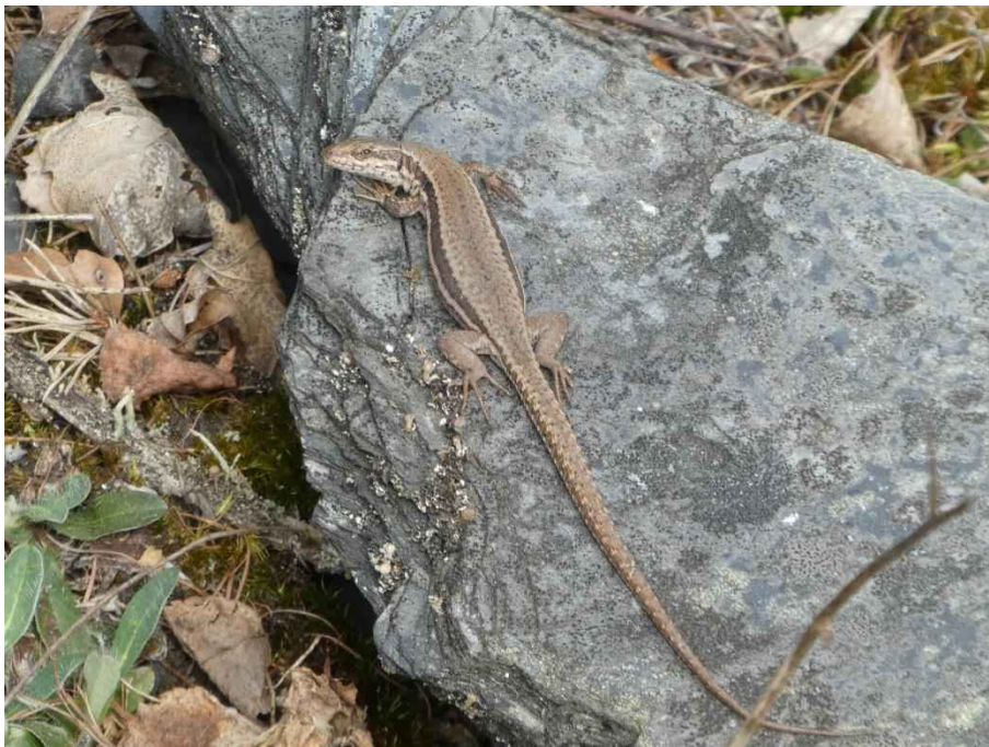
Abb. 3: Mauereidechsen-Weibchen im Schiefer-Abraum. 17.04.2020.

Die gesamte Größe der Population und die Ausdehnung auf der Fläche sind weiterhin nicht bekannt.