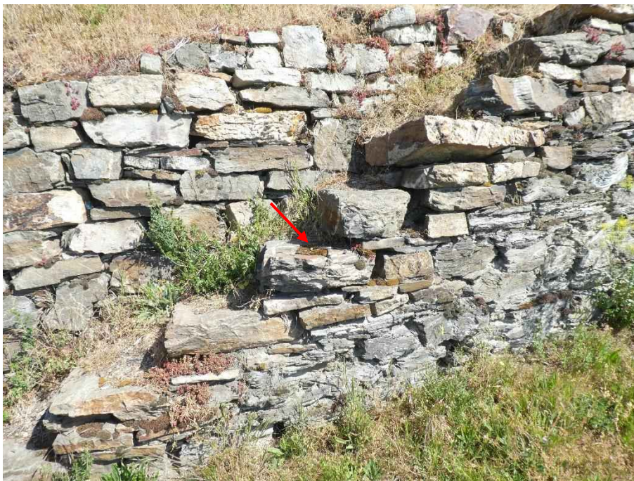
Abb. 8: Trockenmauer im Bächer Grund mit Totfund einer Schlingnatter. 08.05.2020.

Eine Abgrenzung einzelner Populationen oder Vorkommensbereiche im Gebiet steht weiter hin aus.