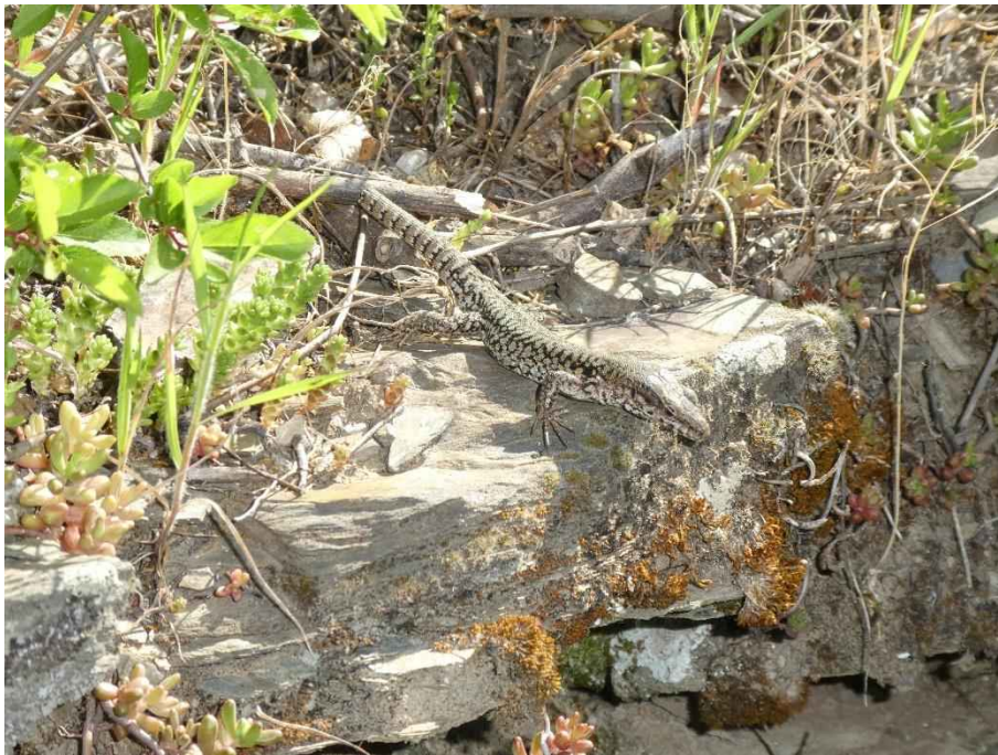
Abb. 7: Mauereidechsenmännchen an einer Trockenmauer am Transekt. 08.05.2020.

Im Gebiet sind kaum Beeinträchtigungen zu erkennen. Freistellungsarbeiten und eine dauerhafte Pflege haben die besiedelbare Fläche in den letzten Jahren sogar stark vergrößert. Allerdings führte die Ziegenbeweidung zu Beeinträchtigungen der Trockenmauern. In einigen Bereichen war die Vegetation an Mauerfuß und Mauerkrone komplett abgefressen. Mit lückigem Bewuchs bieten diese Areale der Mauereidechse geeignete Jagdgebiete und gleichzeitig Deckung. Die Veränderung wird als mittlere Beeinträchtigung angesehen. Es ergibt sich Wertstufe B.