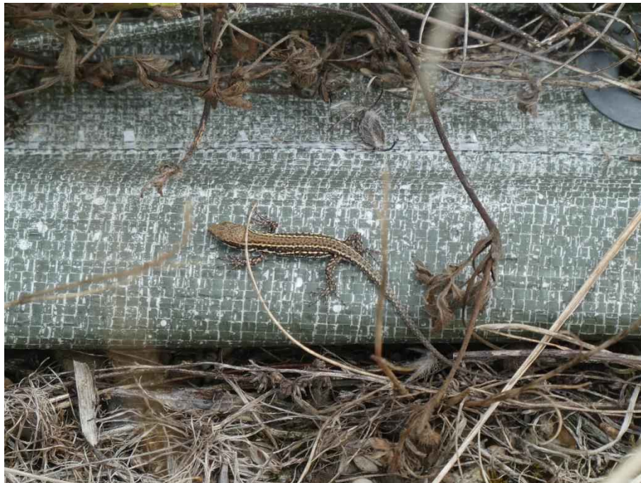
Abb. 5: Schlüpfling der Mauereidechse. 03.09.2020.

Für das Vorkommen am Gernsheimer Bahnhofsgelände gilt dasselbe, wie für die anderen Probestellen: Für eine gesicherte Einstufung wäre es notwendig, die aktuelle flächige Ausdehnung der Population zu ermitteln.