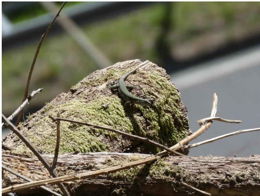
Abb. 2: Mauereidechsen-Männchen in Hirschhorn. 21.04.2020.