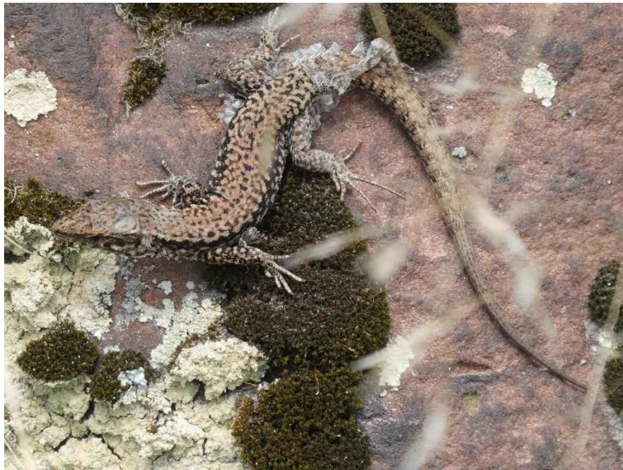
Abb. 6: Mauereidechsenmännchen in Häutung. 02.09.2020

Zu Beginn der Kartiersaison 2020 waren die Hänge im Untersuchungsgebiet freigestellt. Die Entbuschung musste im Winter 2019/2020 erfolgt sein. Allerdings waren der westliche Teil des Transektes nicht bearbeitet worden. Ein dorthin führender Wanderweg war aufgegeben und gesperrt worden. Er ist nicht mehr erreichbar. Im Laufe der Saison stellte sich am Transekt neuer Pflanzenwuchs ein, stellenweise zur Beschattung von potenziellen Sonnplätzen führte. Eine massive Störung, wie bei den Rodungsarbeiten in 2017, lag in 2020 jedoch nicht vor. Aufgrund der voranschreitenden Sukzession ergibt sich die Wertstufe C.