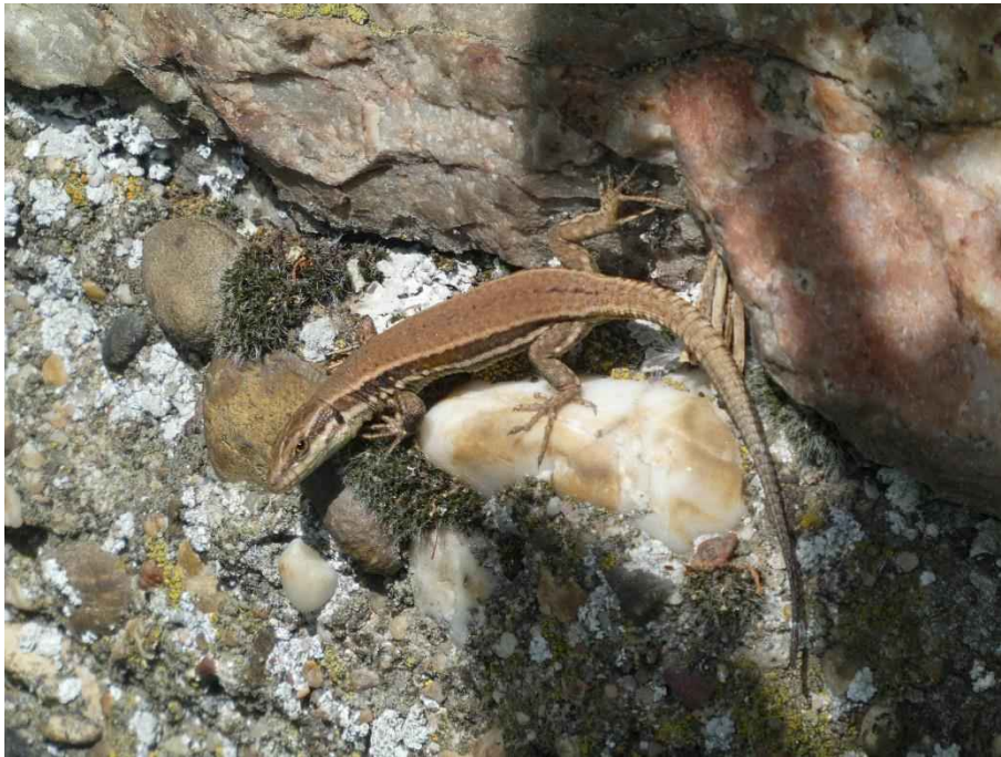
Abb. 4: Vorjähriges Weibchen der Mauereidechse. 08.05.2020.

Die Ausdehnung der Mauereidechsenpopulationen in und um Rüdesheim ist weiterhin nicht bekannt.