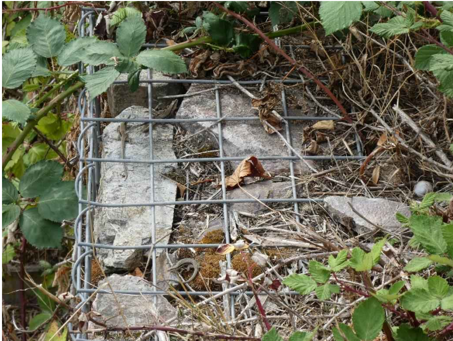
Abb. 9: Drei Mauereidechse an einer Gabione im Gebiet Oestrich-Winkel, Dachsberg. 28.08.2020.

Beeinträchtigungen sind nicht zu erkennen. Der Lebensraum wurde in den letzten Jahren kontinuierlich durch die schrittweise Sanierung von Trockenmauern aufgewertet. Es folgt für den Parameter die Einstufung A.