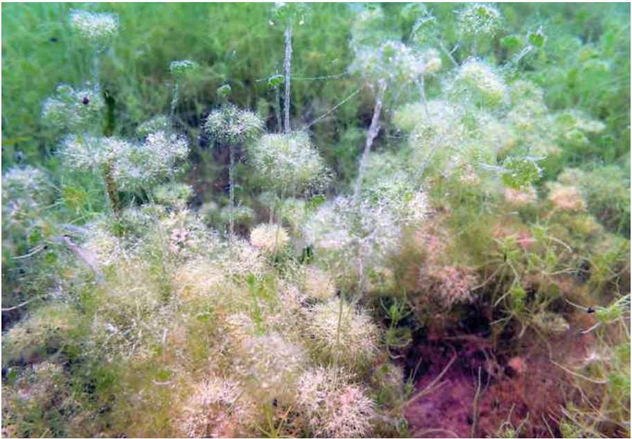
Abb. 5: Nitella tenuissima im Weilerhofer See. Eine 2021 in Hessen nicht erneut nachgewiesene Art.

Im letzten Jahrzehnt gelang lediglich die Bestätigung des Vorkommens von Nitella tenuissima in Weilerhofer See bei Wolfskehlen (Abb. 5), wo sie allerdings ab 2018 nicht erneut nachgewiesen werden konnte.