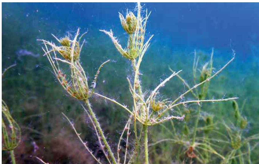
Abb. 3: Chara hispida im Weilerhof

Die Pflanze (Abb. 3) ist deutlich rückläufig. In der Untermain- und Oberrheinebene bestehen weiterhin einige Vorkommen, wobei sowohl Kiesgruben als auch Gräben besiedelt werden. In Nordhessen wurden zwei Vorkommen – Hegholz bei Meimbressen sowie Frankenteich westlich Ehrsten – durch Umwandlung von Fisch- in Naturschutzteiche hoffentlich dauerhaft gesichert.