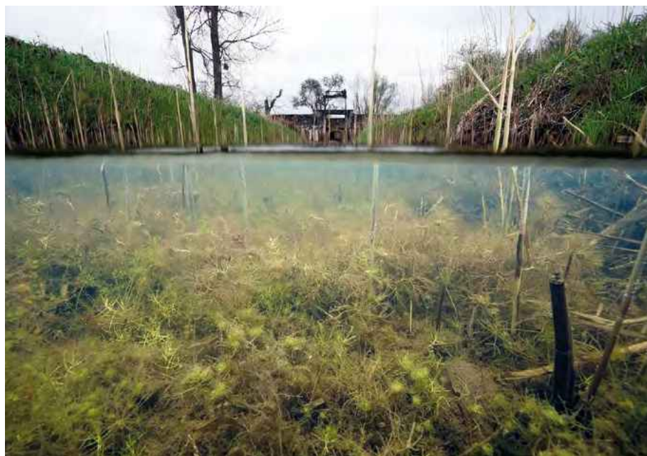
Abb. 4: Lachegraben nördlich Leeheim mit Nitella capillaris und Tolypella intricata

Die Art (Abb. 4) ist nur im Frühjahr und Frühsommer zu finden und ihre Vorkommen sind weitgehend stabil. Nitella capillaris konnte auch im Mittelgebirgsraum (Niederweimarer See) und in der Untermainebene (Gräben der Mönchbruchwiesen) nachgewiesen werden. Eventuell wird das Vorkommen dieser Characeen-Art unterschätzt, da zum Schutz der in diesem Lebensraum brütenden Vogelarten in der Vegetationsperiode der Characeen-Art nur selten Tauchuntersuchungen durchgeführt werden können.