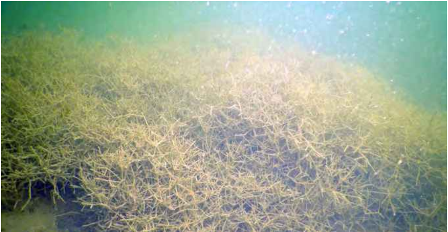
Abb. 6: Nitellopsis obtusa in der Stockelache. Diese Pflanze bildet großflächige, durch ihre Struktur unverkennbare Polster.