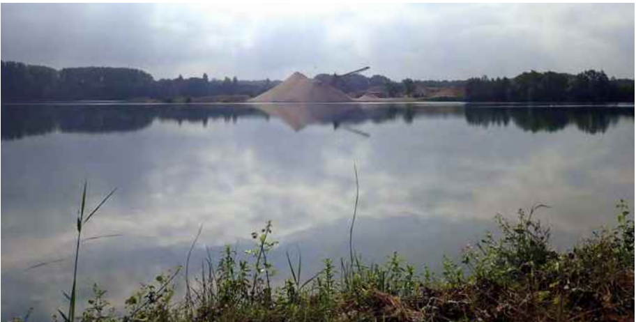
Abb. 1: Kiesgrube Weilerhof bei Griesheim. In diesem mit elf Characeen-Arten (Stand 2017) ehemals artenreichsten Gebiet konnten 2020 keine Characeen nachgewiesen werden. Intensive Abbautätigkeit mit starker Gewässertrübung dürfte hierfür ursächlich gewesen sein. Nach Abbauende dürfte sich die Characeen-Vegetation regenerieren.

Nur sehr selten finden sich Characeen heute in natürlichen Gewässern, zum Beispiel in einigen Altrheinen (KORTE et al. 2010a). Diese sind in der Regel nährstofftolerante Arten wie Chara globularis , Nitella mucronata oder Nitellopsis obtusa .