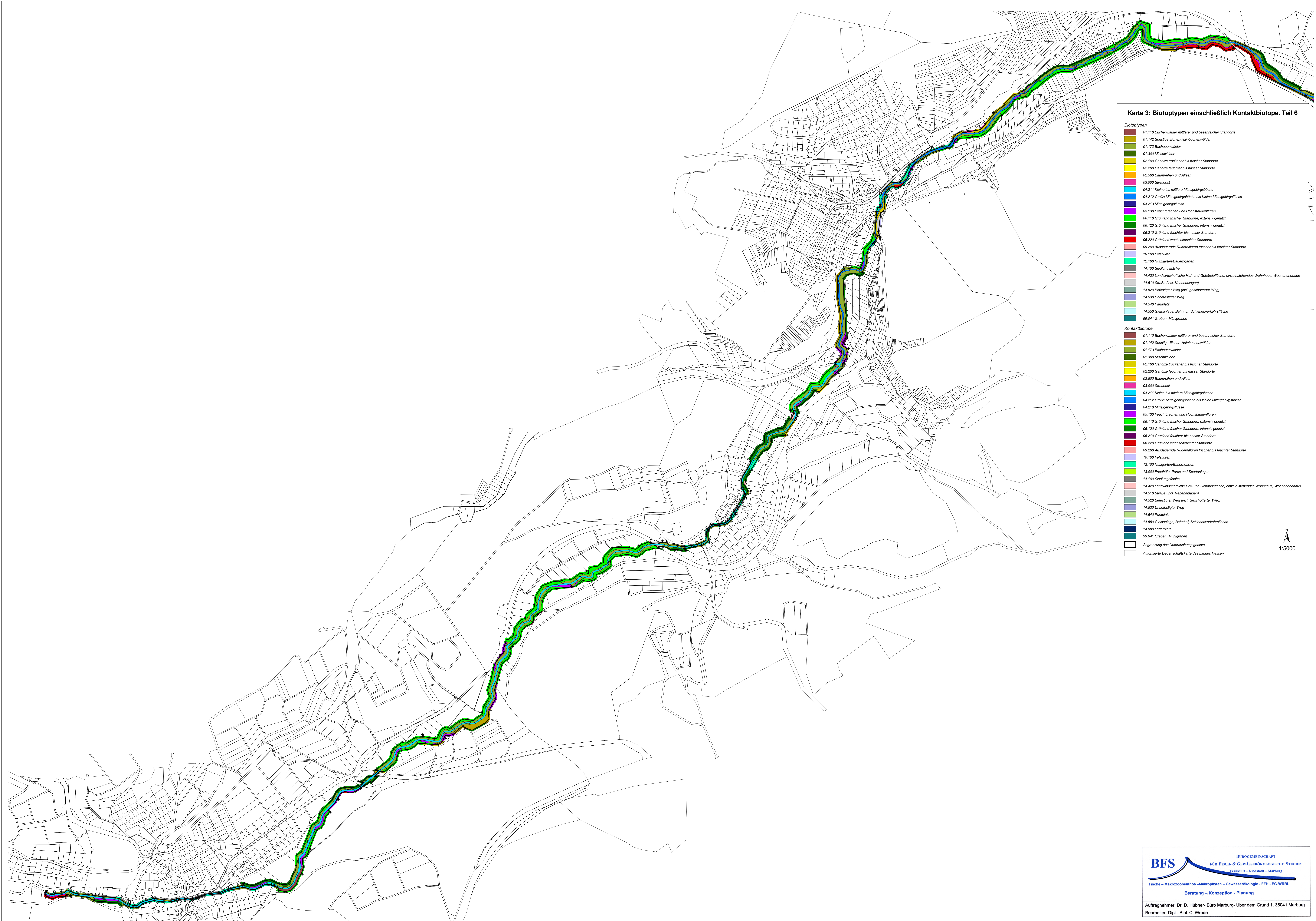
Karte 3: Biotypen einschließlich Kontaktbiotope. Teil 6