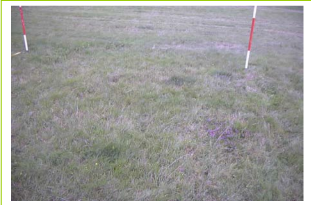
Abb. 30: D 11, LRT *6230 Borstgrasrasen, Aufnahme 2001