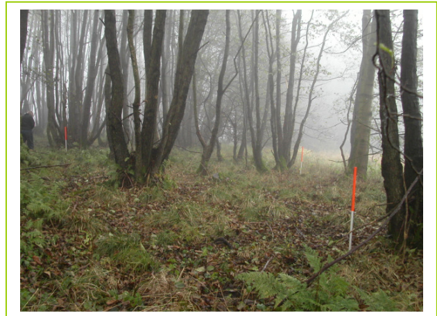
Abb. 33: D 17; LRT *91E0 Erlen- und Eschenwälder, flächiger Bestand mit Stockausschlägen