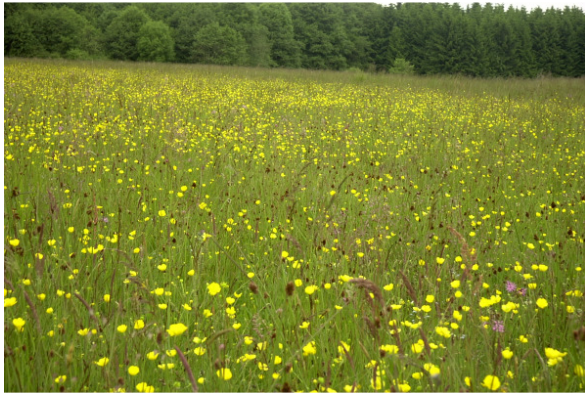
Abb. 26: Frühjahrsaspekt des LRT 6410 Pfeifengraswiesen 2001