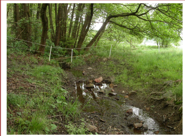
Abb. 15: Das Fließgewässer wurde in die Weide miteinbezogen