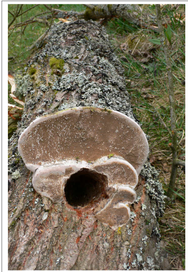
Abb. 23: Spechthöhle in der gefällten Weide