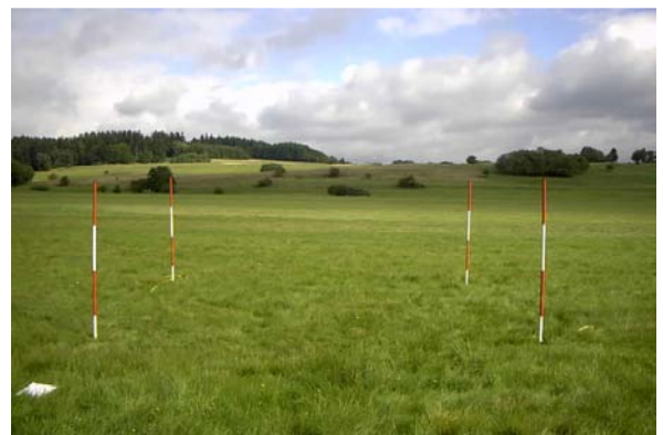
Abb. 29: D 10, LRT *6230 Borstgrasrasen, Aufnahme 2001 und 2008 (Foto 2001)