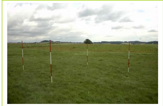
Abb. 31: D 12, LRT 6510 Magere Flachland-Mähwiesen, Aufnahme 2001