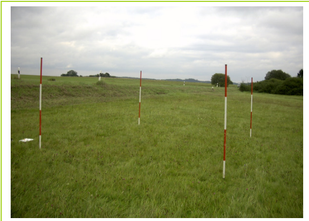
Abb. 32: D 13, LRT 6510 Magere Flachland-Mähwiesen, Aufnahme 2001