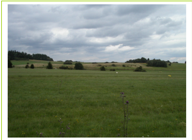
Abb. 2: Überblick in nördliche Richtung mit schafbeweidetem Hügel