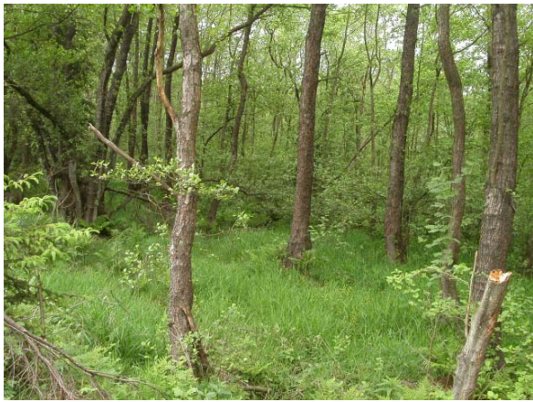
Abb. 7: D 17, LRT *91E0 Erlen- und Eschenwälder