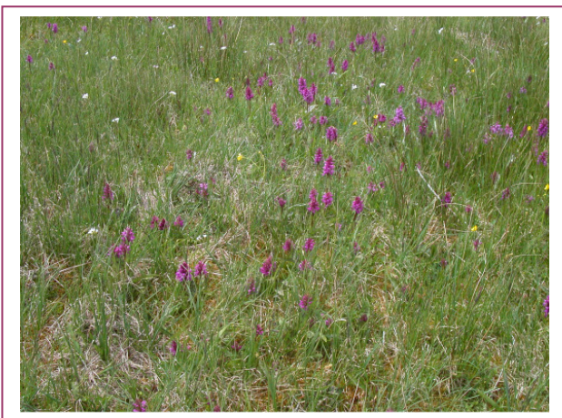
Abb. 11: Orchideen-Aspekt in den Feuchtwiesen