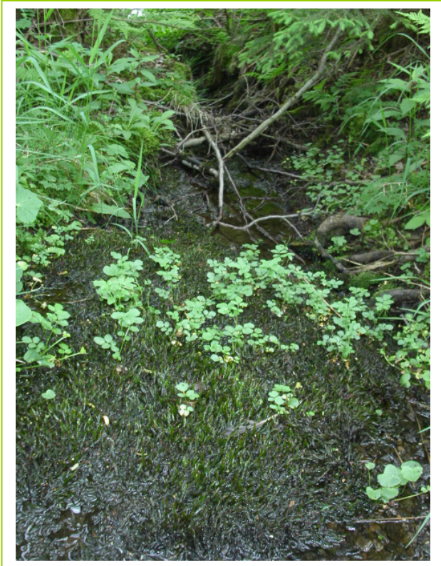
Abb. 9: LRT 3260 Fließgewässer mit Brunnenmoos ( Fontinalis antipyretica )