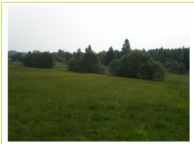
Abb. 12: LRT *91E0 Erlen- und Eschenwälder, LRT 6510 im westlichen Tal des Gebietes