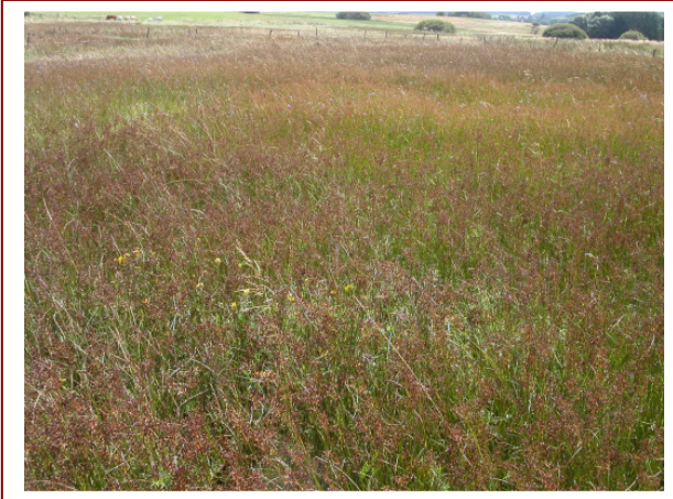
Abb. 13: Juncetum acutiflori an der Westgrenze in Nachbarschaft zur Wechselfeuchten Wiese (LRT 6410)