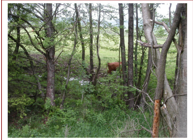
Abb. 14: Beeinträchtigung des LRT 3260; Die Rinder können das Gewässerbett und die Uferbereiche großflächig begehen.