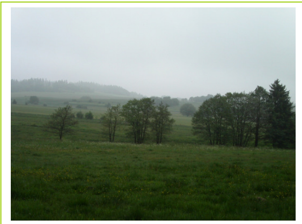
Abb. 3: LRT *6230 Borstgrasrasen vor lückiger Erlengalerie