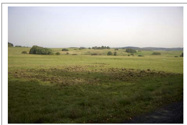
Abb. 24: Wildschweinschaden am Borstgrasrasen (2001)