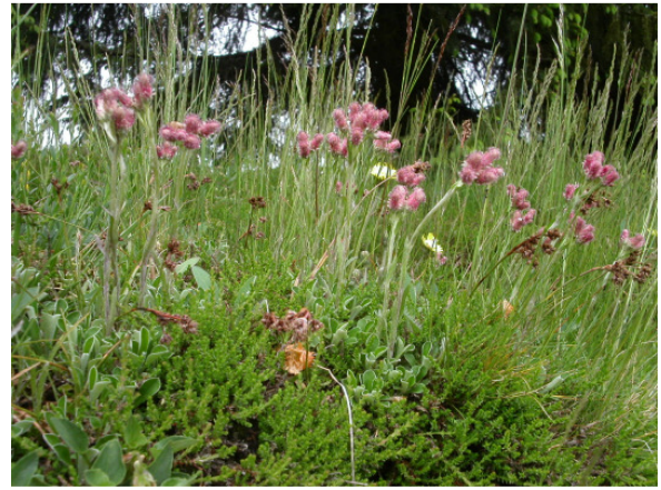
Abb. 6: Katzenpfötchen ( Antennaria dioica ) im LRT *6230 Borstgrasrasen