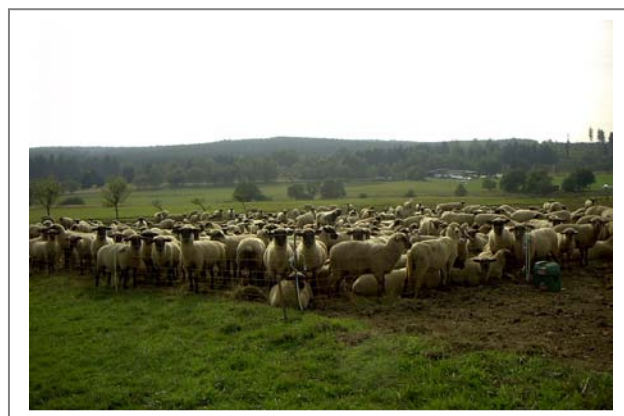
Abb. 25: Gepferchte Schafe im FFH-Gebiet (2001)