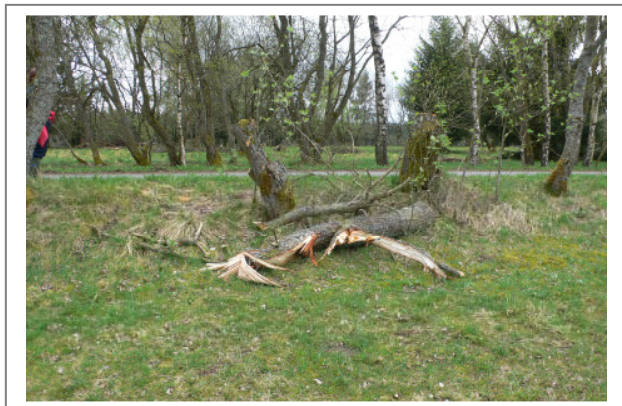
Abb. 22: Gefällte Weide an der Zufahrt zur Segelflughalle