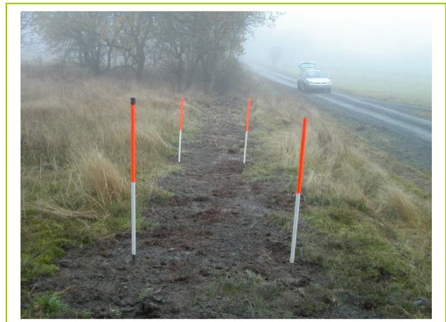
Abb. 21: D 18, beschädigter LRT *6230 Borstgrasrasen