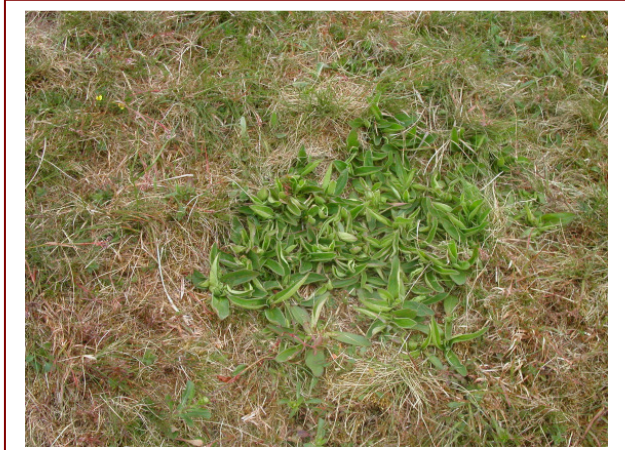
Abb. 16: Arnica montana kommt im Bereich der Start- und Landebahn aufgrund der häufigen Mahd nicht mehr zur Blüte