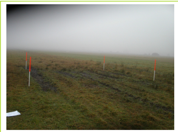
Abb. 17 links oben: Fahrspuren nach dem Flugtag im Mai 2008