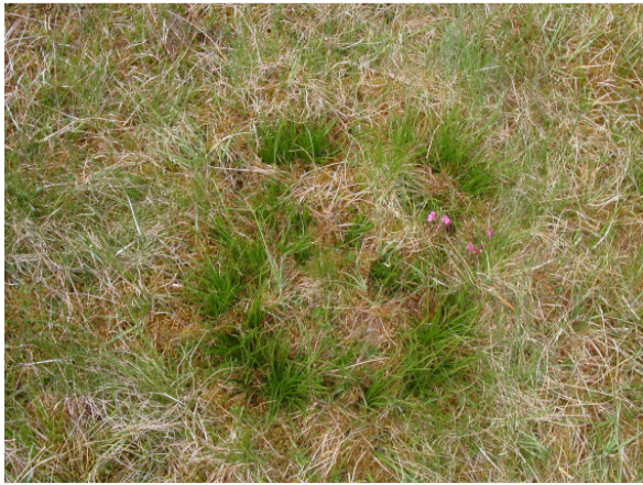
Abb. 5: Sparrige Binse ( Juncus squarrosus ) im LRT *6230 Borstgrasrasen