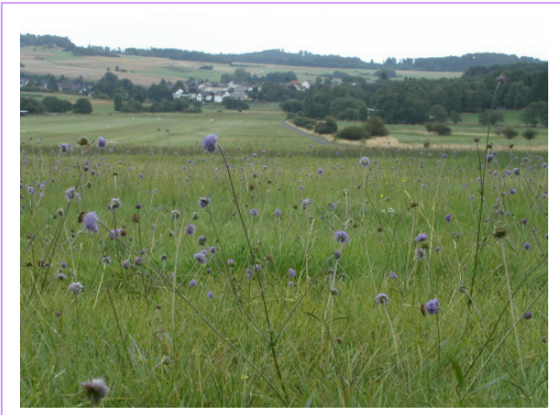
Abb. 1: Überblick über die Start- und Landebahn: im Vordergrund wechselfeuchtes Grünland mit Teufelsabbiß im Hintergrund die Ortschaft Bottenhorn