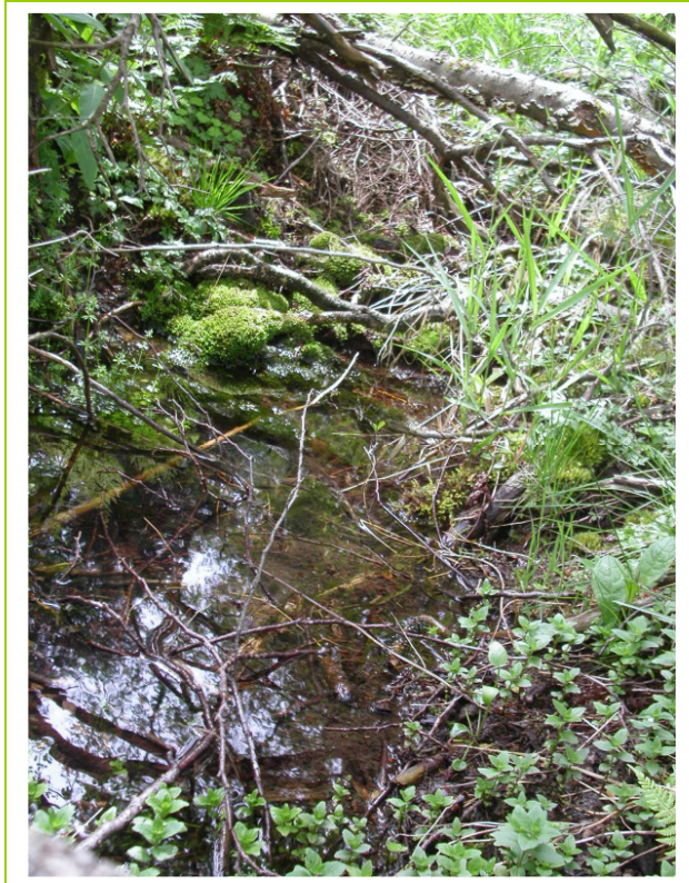
Abb. 10: LRT 3260 Fließgewässer