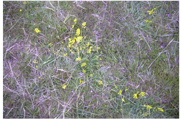
Abb. 27: D 3, LRT *6230, Aufnahme 2001 und 2008 (Foto 2001)