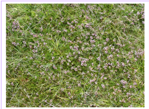
Abb. 4: LRT *6230 Borstgrasrasen, Ausbildung mit Besenheide ( Calluna vulgaris )