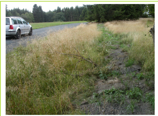
Abb. 20: Schotterablagerungen vom Wegebau im LRT *6230 Borstgrasrasen