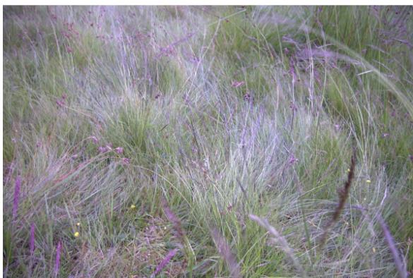
Abb. 28: D 1, LRT *6230, Aufnahme 2001 und 2008 (Foto 2001)