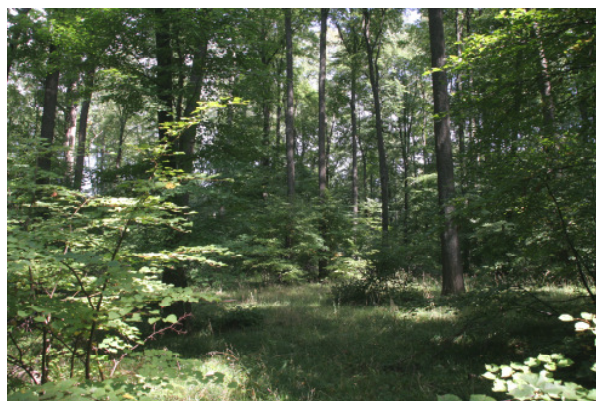
Abb. A-10: Vegetationsaufnahme V 2 (LRT *9180)