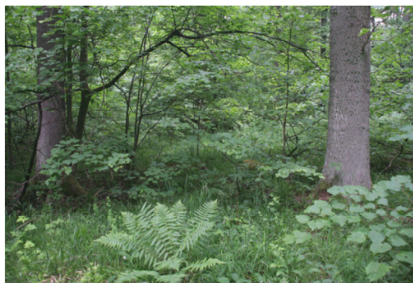
Abb. A-9: Vegetationsaufnahme V 1 (LRT *9180)