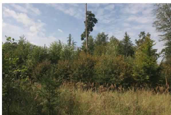
Abb. A-14: Entwicklungsfläche für den LRT *9180