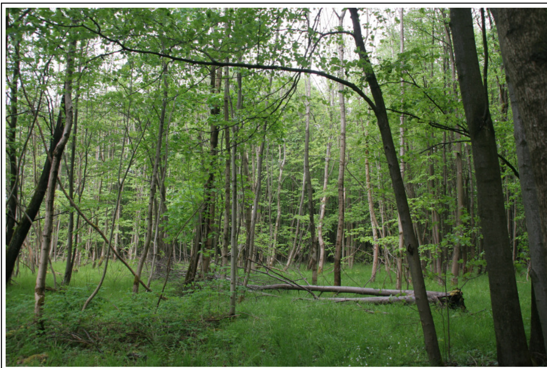
Abb. A-2: LRT *9180, Erhaltungszustand B; junge Winter-Linden im Gebietsteil Maschhag