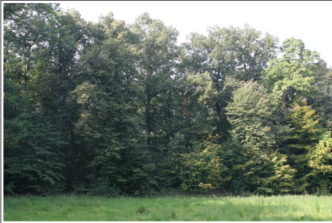
Abb. A-1: LRT *9180, Erhaltungszustand A; Linden-Ahorn-Wald mit gut ausgebildetem Waldinnensaum im Gebietsteil Maschhag