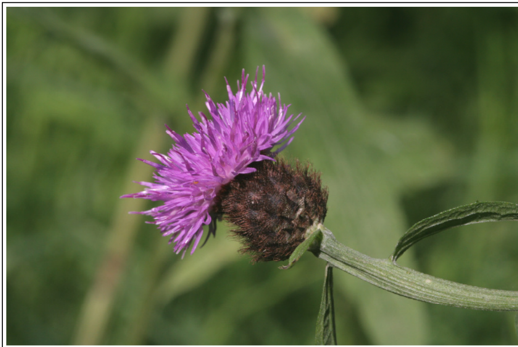
Abb. A-8: Hain-Flockenblume ( Centaurea nigra subsp. nemoralis )