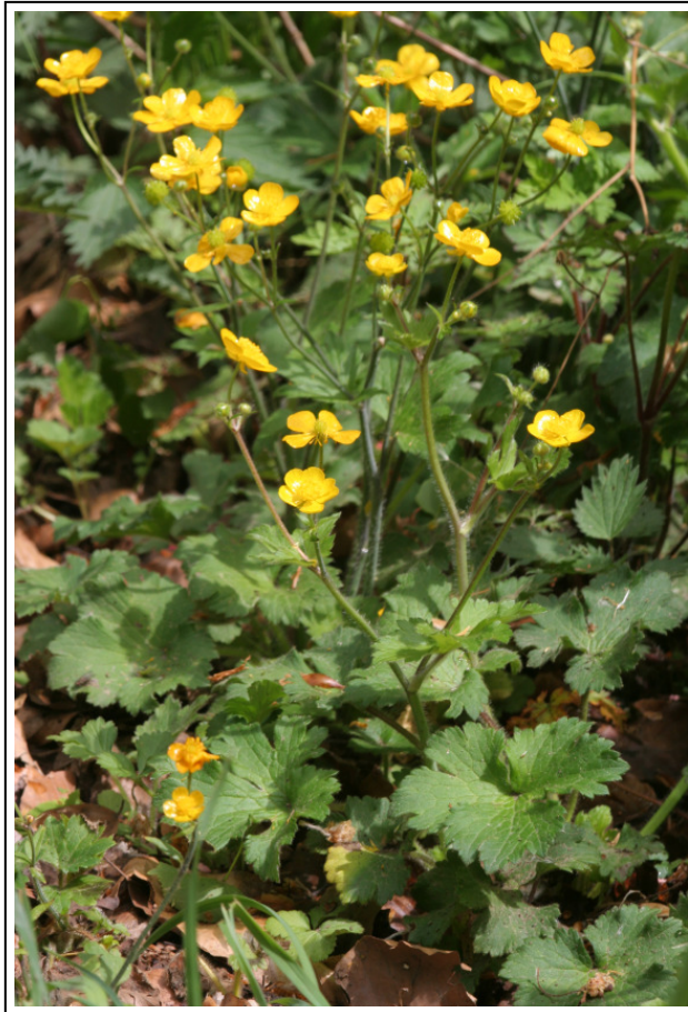
Abb. A-7: Wolliger Hahnenfuß ( Ranunculus lanuginosus )