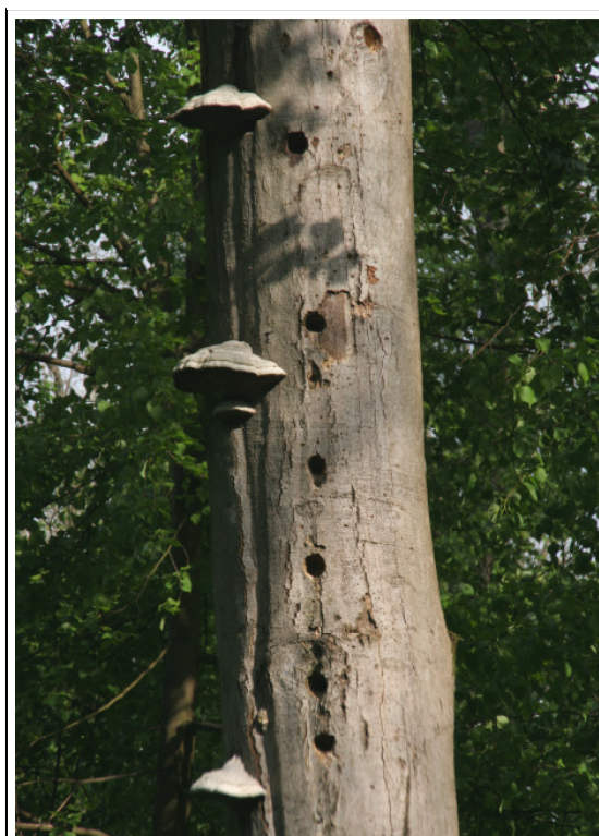
Abb. A-6: LRT *9180; Spechtbaum am Wegrand (Maschhag)