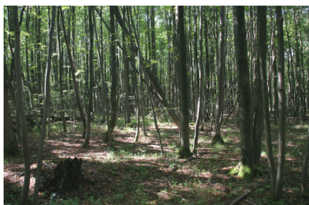
Abb. A-13: Vegetationsaufnahme V 5 (LRT *9180)