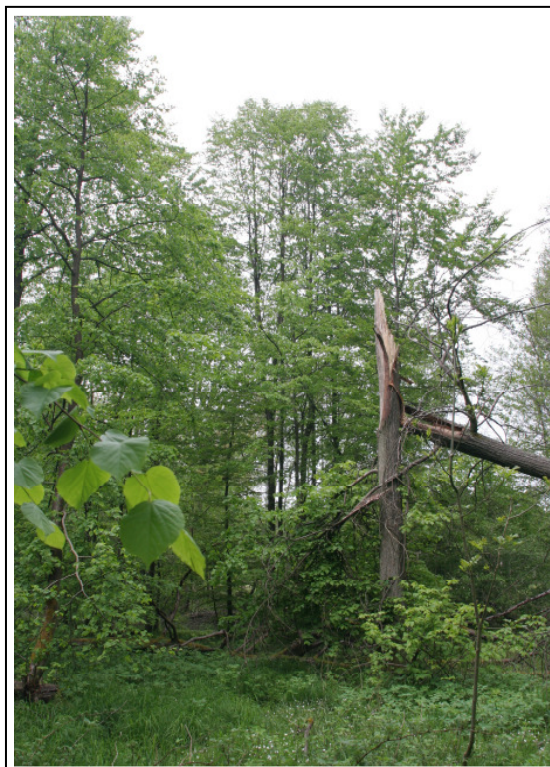
Abb. A-4: LRT *9180; Dynamische Prozesse bringen naturnahe Waldstrukturen hervor (Seifen)