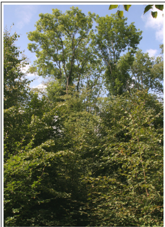
Abb. A-3: LRT *9180; hochwüchsige Eschen überragen die Strauchschicht aus Winter-Linde (Maschhag)