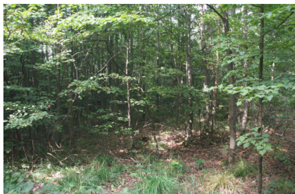
Abb. A-11: Vegetationsaufnahme V 3 (LRT *9180)