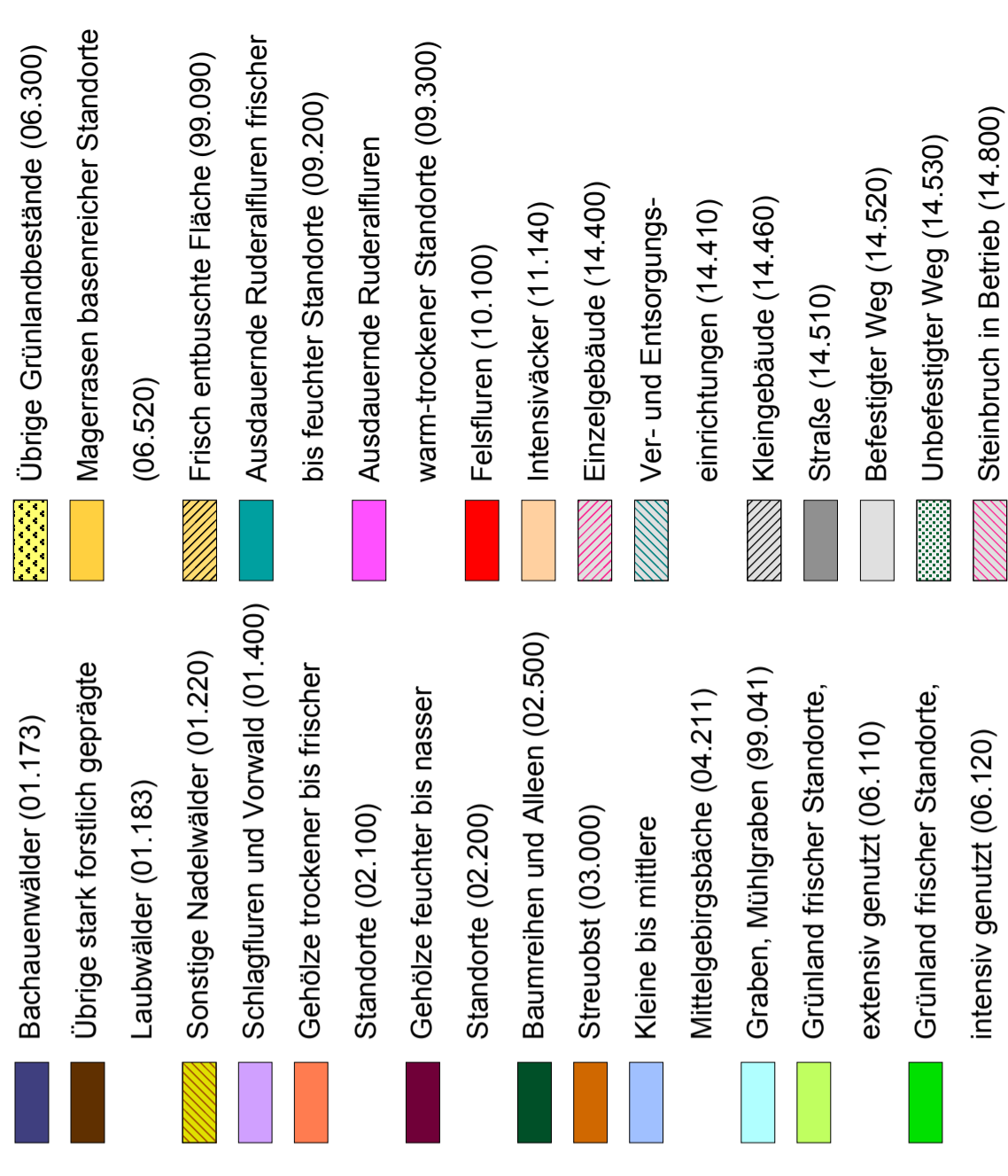
Karte 2: Biotoptypen (HB), Kontaktbiotope und Einflüsse *