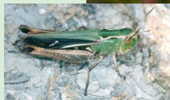
Brombeer-Zipfelfalter (oben) und Heide-Grashüpfer (unten)