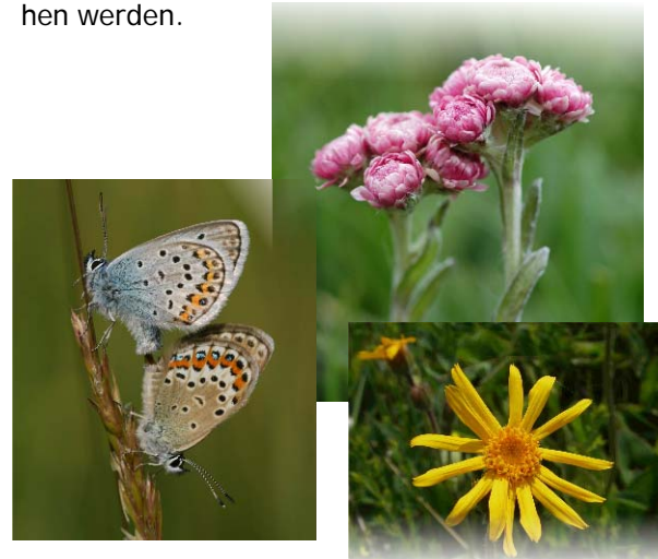
Katzenpfötchen (oben), Geißklee-Bläuling (links) und Arnika (unten), Arten der trockenen Heiden und Hutungen

Ein besonderes Charakteristikum der Strickshute sind die mächtigen Hutebuchen, deren Alter auf 250-300 Jahre geschätzt wird und die auf eine weit zurückliegende Nutzung als Gemeindehütung hinweisen. Dabei wurden früher täglich zwischen Mai und September bis zu 200 Rinder der Rasse ‚Rotes Höhenvieh‘ von einem Hirten aufgetrieben und abends wieder zurück in die Ställe geführt. Das durch diese Nutzung entstandene und heute besonders wertvolle, kleinflächig wechselnde Vegetationsmosaik aus Borstgrasrasen, Heiden und Mähgrünland beherbergt bemerkenswerte Pflanzen- und Tierarten. So kommen der im Lahn-Dill-Bergland seltene Haar-Ginster und die Arnika vor. Heide-Grashüpfer, Gefleckte Keulenschrecke und Geißklee-Bläuling sind an diese Lebensräume gut angepasst. Insgesamt müssen die artenreichen Borstgrasrasen der Strickshute als die am besten erhaltenen im ganzen Lahn-Dill-Bergland angesehen werden.