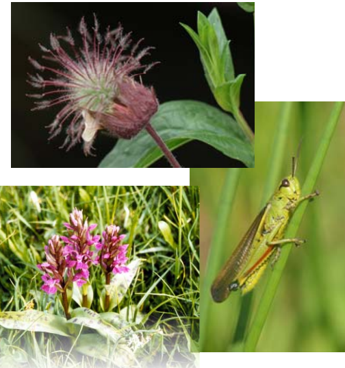
Bach-Nelkenwurz (Samenstand, oben), Sumpfschrecke (rechts) und Geflecktes Knabenkraut (unten), Charakterarten der Feuchtwiesen.

In den Feucht- und Nasswiesenbereichen, die heute nur noch sporadisch genutzt werden, finden sich als Charakterarten Geflecktes und Breitblättriges Knabenkraut, Schmalblättriges Wollgras, Fieberklee und Sumpf-Veilchen.