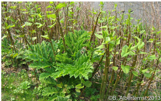
Naturferner Uferbereich eines Fließgewässers mit Riesenbärenklau und Knöterich

Viele unserer Fließgewässer sind durch menschliche Nutzungen in ihren natürlichen Strukturen stark beeinträchtigt und verändert. Ziel einer Renaturierung ist es, degradierte und übernutzte Gewässer wieder in einen naturnäheren Zustand zu versetzen.