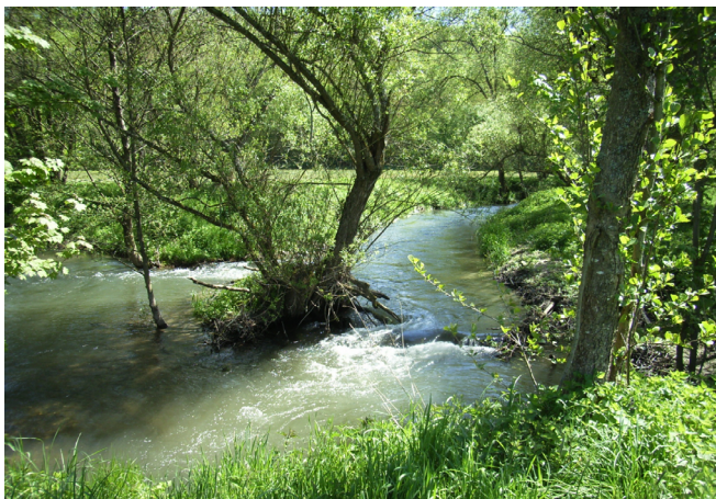
Naturnaher Abschnitt der Weil bei Weilmünster

Verschleppungsprävention gebiets- fremder invasiver Arten im Rahmen von baulichen Maßnahmen