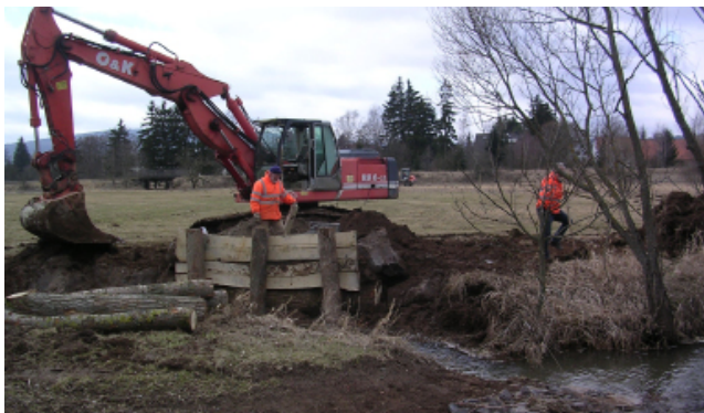
Renaturierung des Waaggrabens bei Grebenhain

Vielen Dank für Ihr Verständnis und Ihre Umsicht!