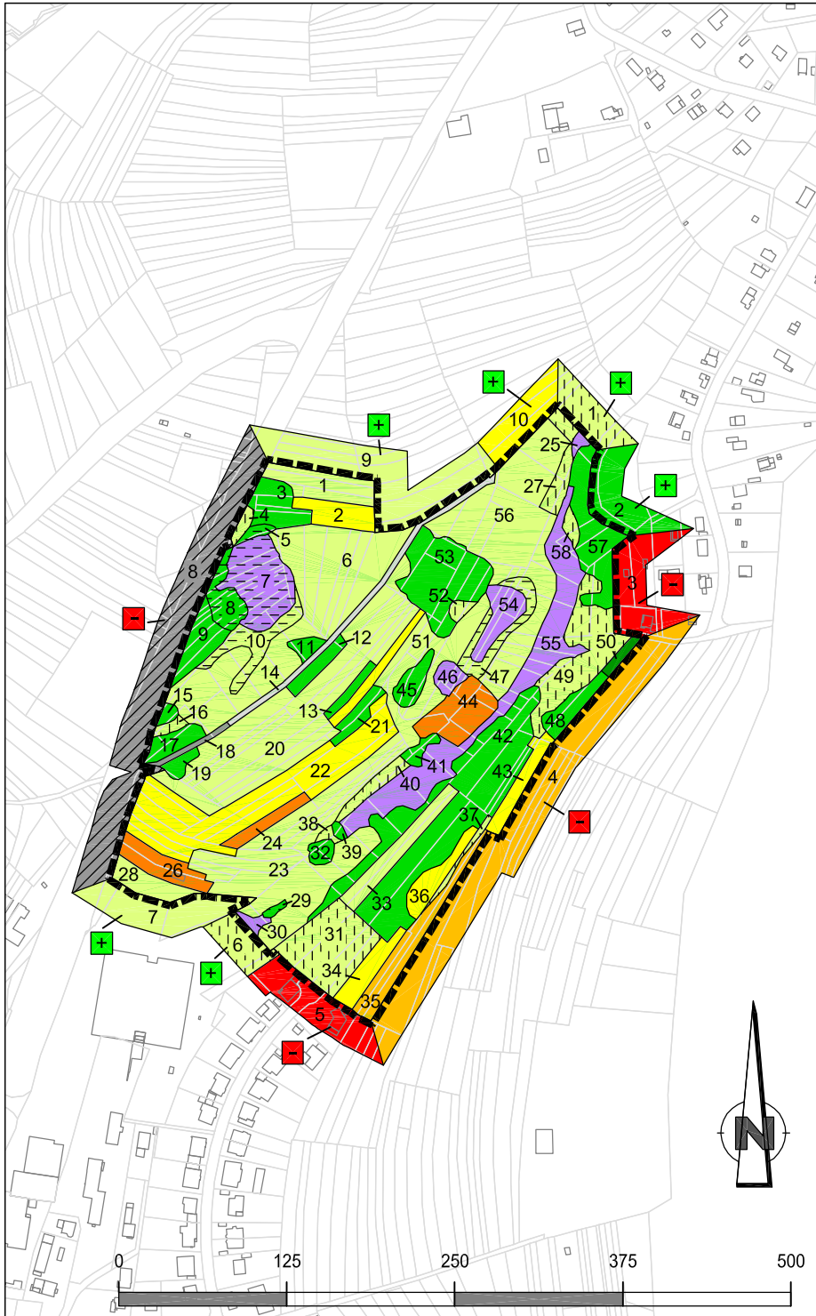
Datengrundlage: Amtliche Liegenschaftskarte, mit Genehmigung der Hessischen Verwaltung für Bodenmanagement und Geoinformation (HVBG)