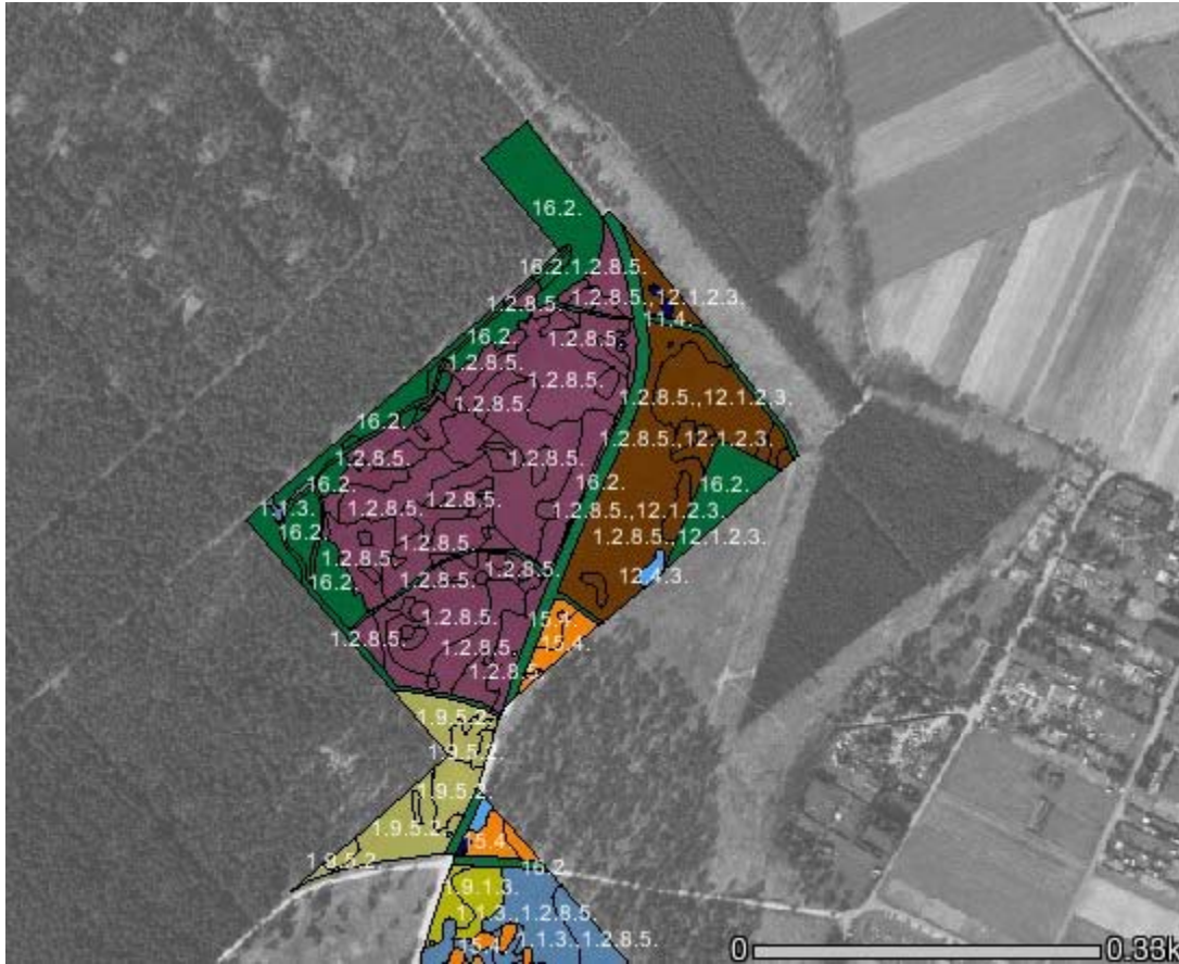
Abbildung 1: NSG Nordteil