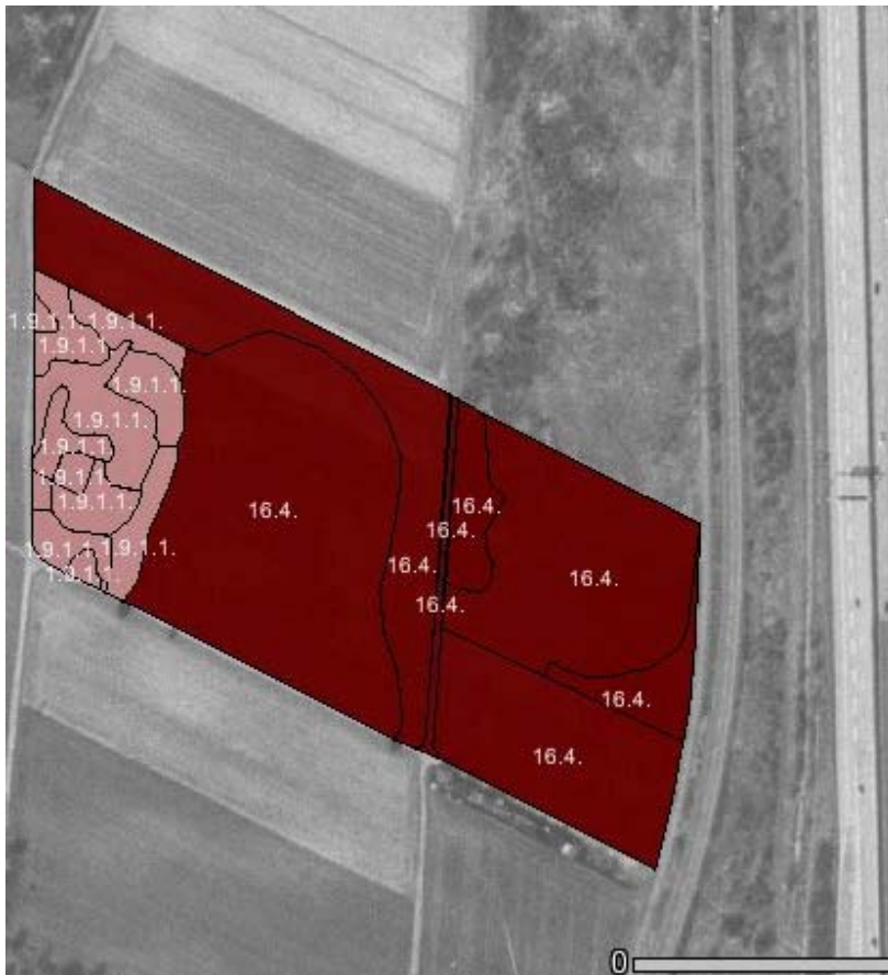
Abbildung 4: Exklave Golfplatz Driving Range