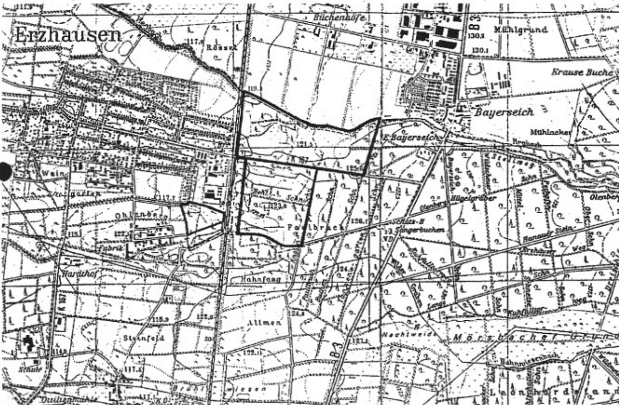
Anlage 1, Auszug aus Top. Karte, Maßstab 1 : 25 000, Blätter 6017 und 6018, des Hessischen Landesvermessungsamtes Vervielfältigungsgenehmigung Nr. 01 - 1 - 007