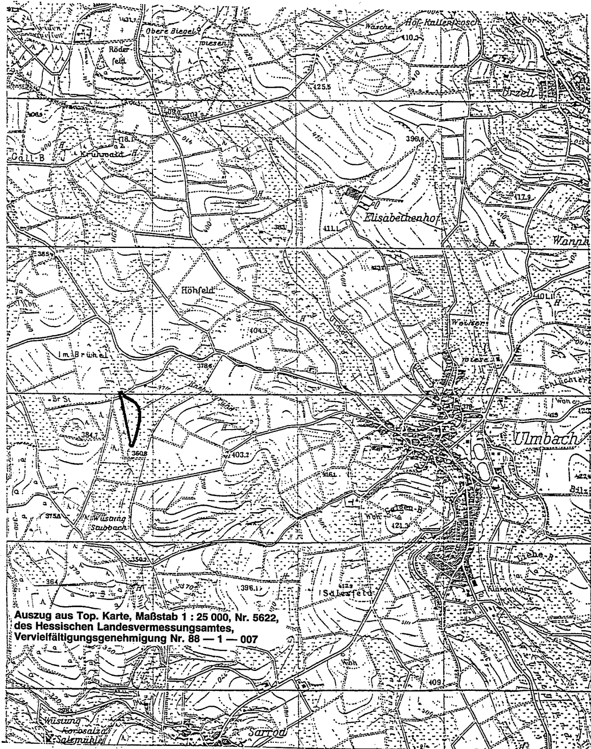
Auszug aus Top. Karte, Maßstab 1 : 25 000, Nr. 5622, des Hessischen Landesvermessungsamtes, Vervielfältigungsgenehmigung Nr. 88 — 1 — 007

(1) Teile des Ochsen- und Knottenberges bei Bad Schwalbach-Fischbach werden in den sich aus Abs. 2 und 3 ergebenden Grenzen zum Naturschutzgebiet erklärt.