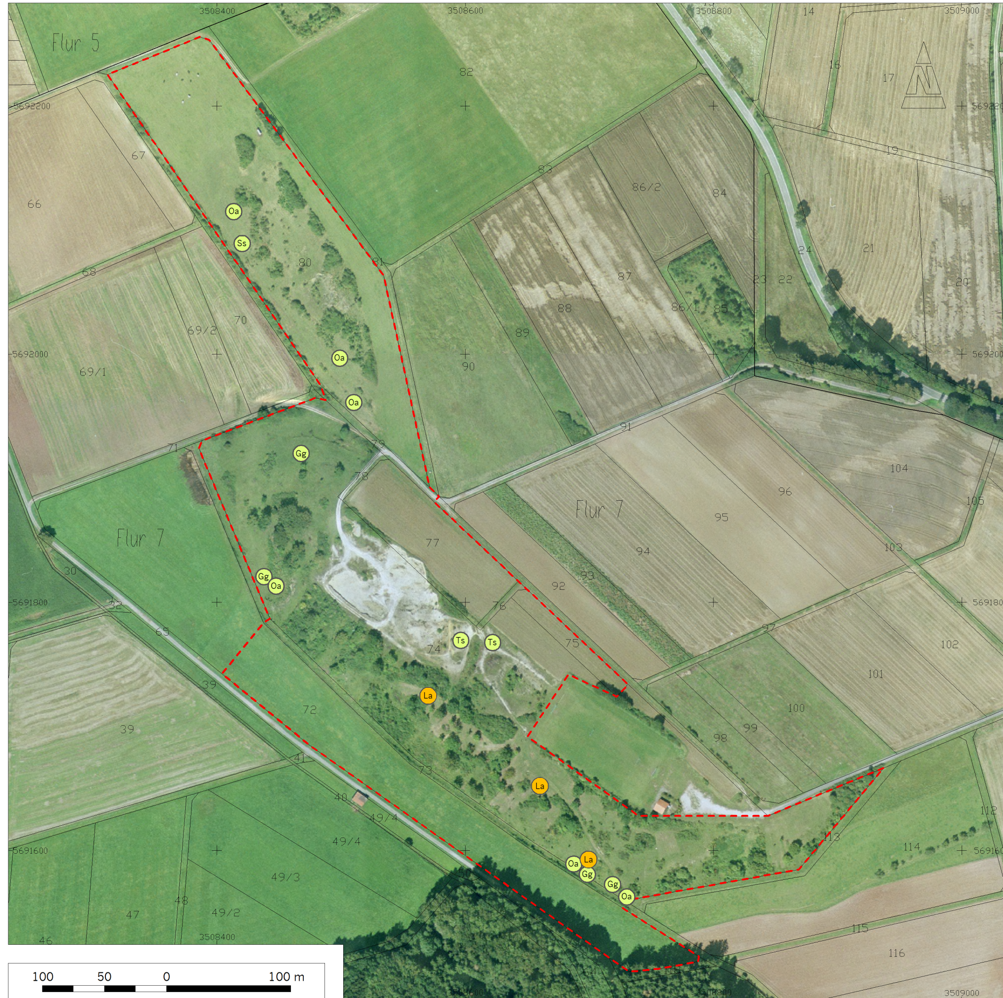
Karte 3-2 Fundpunkte von Anhang-IV-Arten und weiteren bemerkenswerten Arten - Teilgebiet 'Wünne'