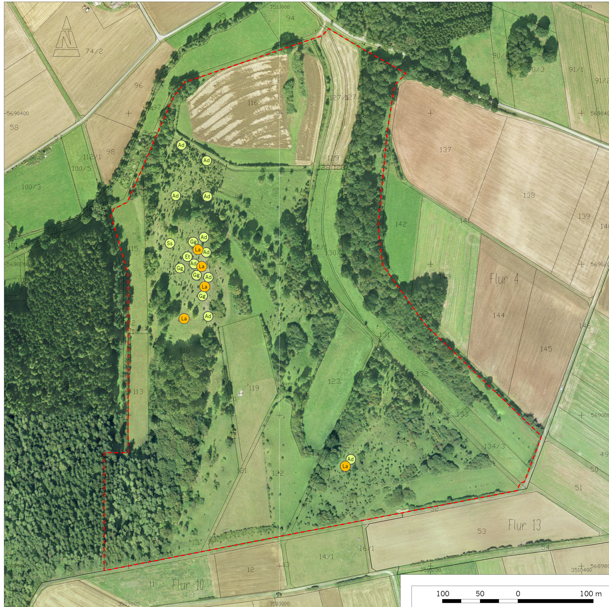
Karte 3-1 Fundpunkte von Anhang-IV-Arten und weiteren bemerkenswerten Arten - Teilgebiet 'Dörneberg'