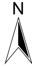
Karte I: Waldstrukturkartierung, Nachweise Anhang II- und IV- Fledermausarten im FFH Gebiet 5017-302 "Sackpfeife"