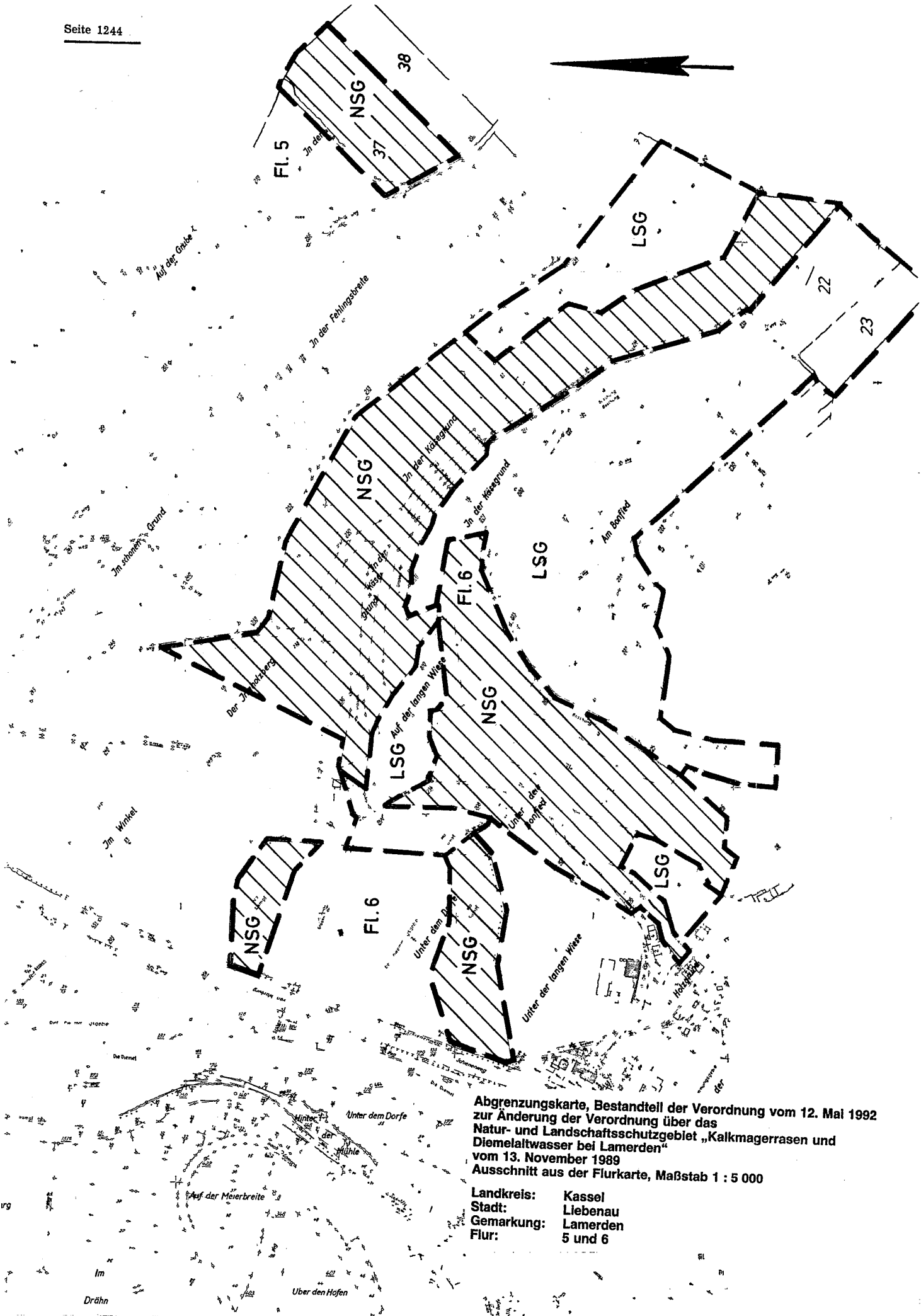
Abgrenzungskarte, Bestandteil der Verordnung vom 12. Mai 1992 zur Änderung der Verordnung über das Natur- und Landschaftsschutzgebiet „Kalkmagerrasen und Diemelaltwasser bei Lamerden“ vom 13. November 1989 Ausschnitt aus der Flurkarte, Maßstab 1 : 5 000

Landkreis: Kassel Stadt: Liebenau Gemarkung: Lamerden Flur: 5 und 6