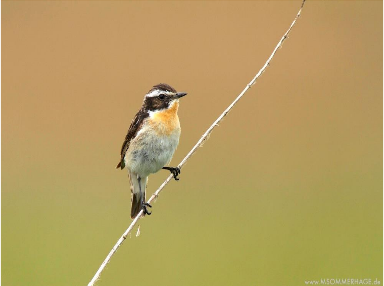
Braunkehlchen ( Saxicola rubetra )