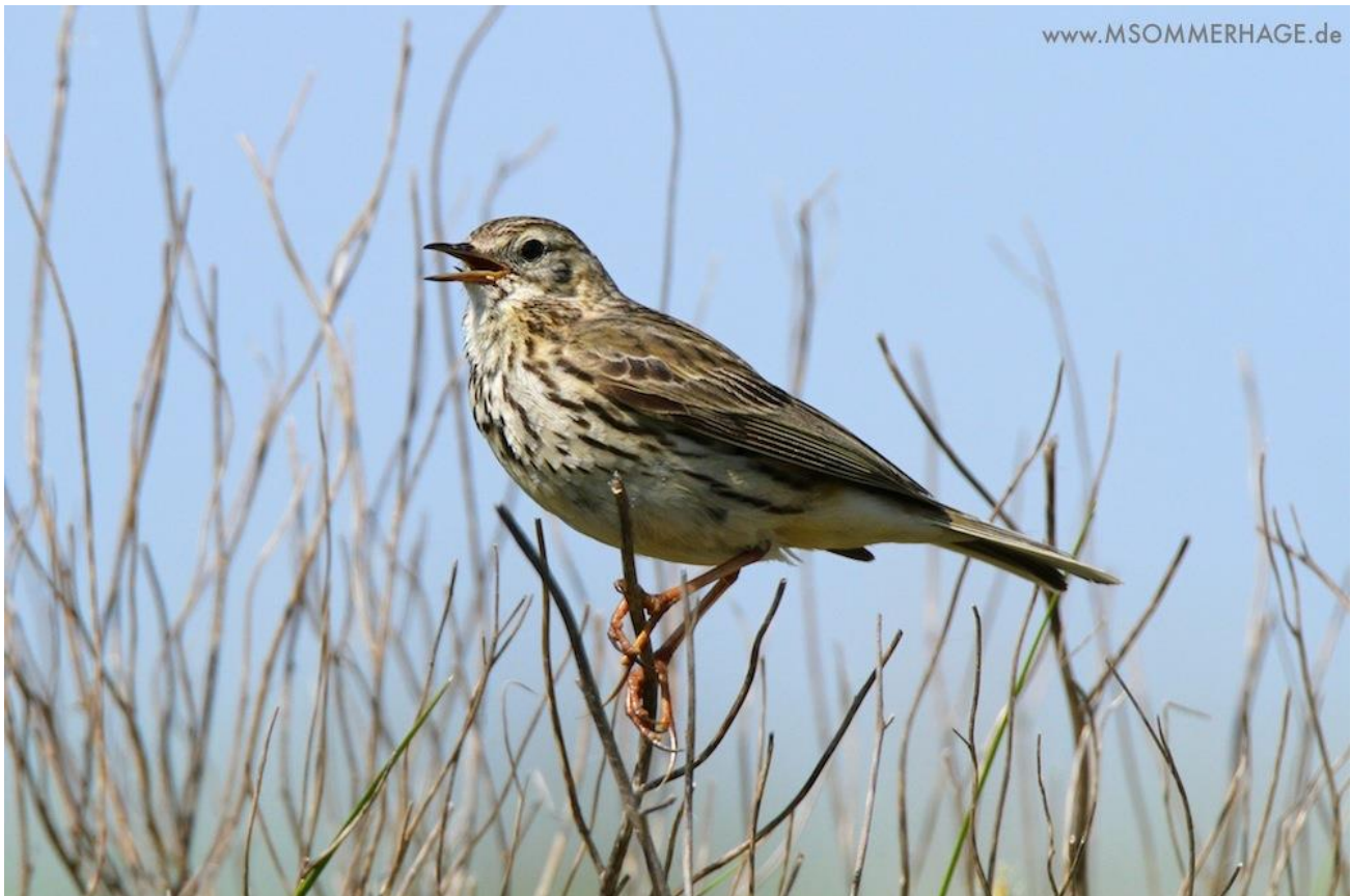
Wiesenpieper ( Anthus pratensis )

Eine Analyse möglicher Ursachen für etwaige Verschlechterungen entfällt, da die Bestände gegenwärtig ganz überwiegend stabil sind bzw. in den Artkapiteln Gründe für etwaige Veränderungen (positive wie negative) genannt werden.