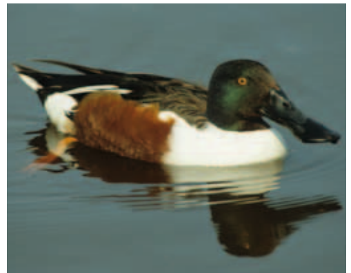
Typisch für die Löffelente ist der breite Schnabel