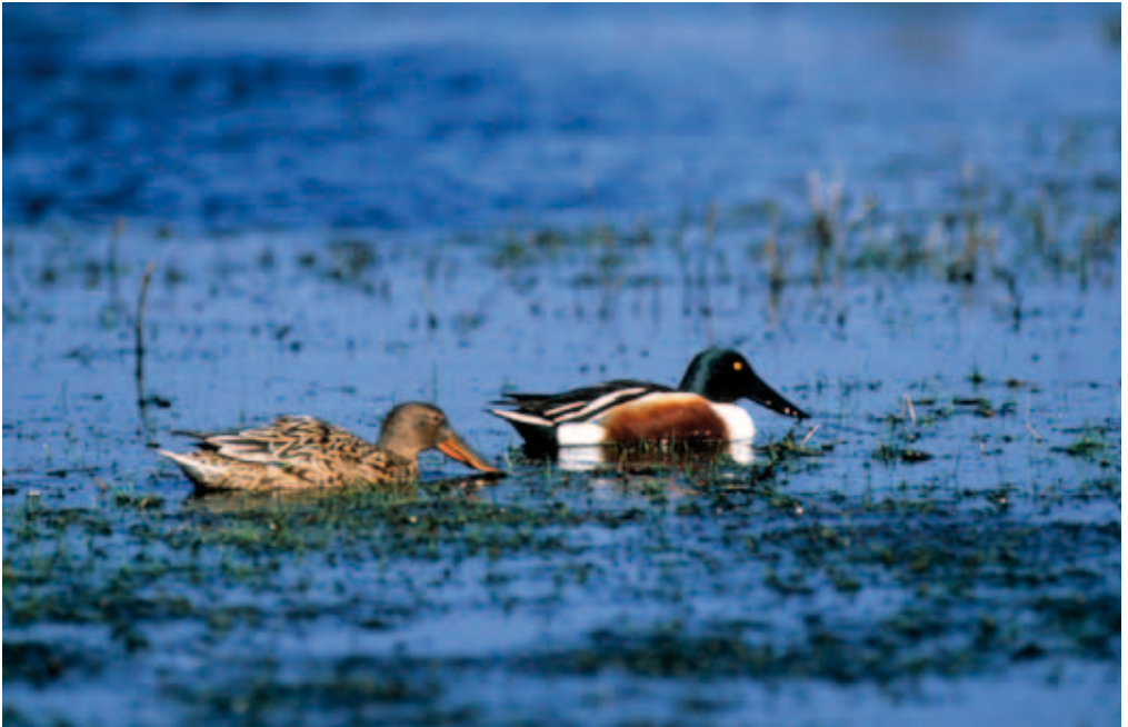
Löffelentenpaar im Prachtkleid

Die Löffelente ist ein Zugvogel nach Artikel 4(2) der Vogelschutzrichtlinie und gehört nach Bundesnaturschutzgesetz zu den besonders geschützten Arten.