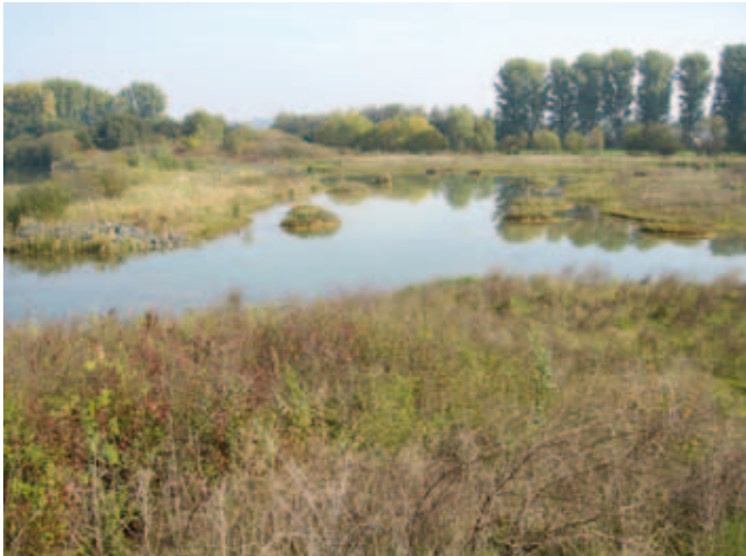
Die Löffelente brütet an flachen Gewässern mit dichter Wasser- und Ufervegetation

Die Löffelente brütet an eutrophen, flachen Binnengewässern mit dichter Wasser- und Ufervegetation (Röhrichte, Rieder), Altwässern, Fischteichen. Stauseen und in nassen Überschwemmungswiesen der Niederungen (Graben-Komplexe mit Tümpeln, Flutmulden usw.); außerhalb der Brutzeit auch auf größeren Stillgewässern aller Art sowie an Meeresküsten und Salzseen.