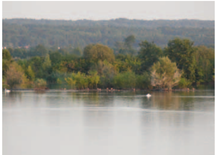
Größere Gewässer dienen der Reiherente sowohl als Brut- als auch als Rasthabitat

Rastbiotope sind darüber hinaus auch größere, schwach strömende Gewässer aller Art.