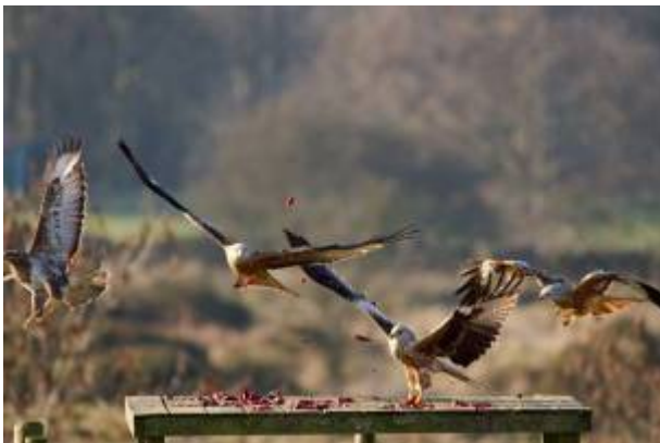
Rotmilanfütterungsplätze (Schindanger) werden sehr schnell vom Aasfresser Rotmilan frequentiert.