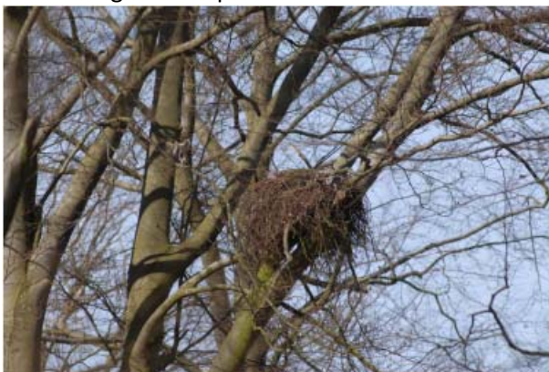
Neststandort im Buchenaltholz

Diese Anforderungen werden im hessischen Staatswald mit der „Leitlinie Naturschutz“ erfüllt. Für den Privat- und Kommunalwald haben sie den Charakter einer Empfehlung, erfüllen jedoch bei Umsetzung den Anspruch des § 44 BNatSchG.