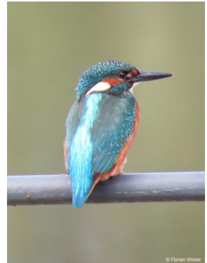
Eisvogel ( Alcedo atthis), 04.09.2015

sein können. Die meisten Eisvögel in Mittel- und Westeuropa sind Standvögel und bleiben in ihren Brutrevieren oder beziehen Quartiere in der Nähe. Alcedo atthis ist in Hessen sowohl Jahres- wie auch Strichvogel und Wintergast.