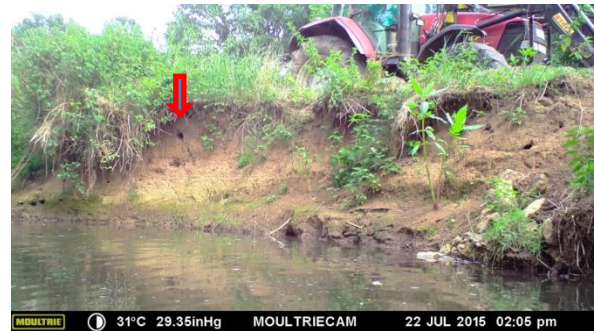
Mahd mit Hilfe eines Traktors an einer angrenzenden Wiese, direkt neben einem Brutplatz, deutlich zu nah am Gewässerrand, 22.07.2015, Moultrie M1100i