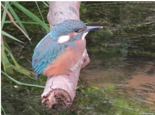
Jungvogel an der Jossa, Foto: Florian Winter

Die Nahrung des Eisvogels besteht überwiegend aus kleinen Fischen. Ab und zu werden auch Neunaugen, in geringem Umfang Libellen-, Schwimmkäferlarven, Rückenschwimmer, Wasserkäfer, kleine Krebstiere, Kaulquappen, Frösche und sehr selten auch erwachsene Libellen verzehrt.