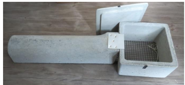
Künstliche Brutröhre im Rohzustand