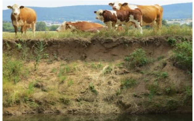
Kinzig bei Gelnhausen, Rinderweide direkt oberhalb einer potentiellen Brutwand ohne Begrenzungszaun