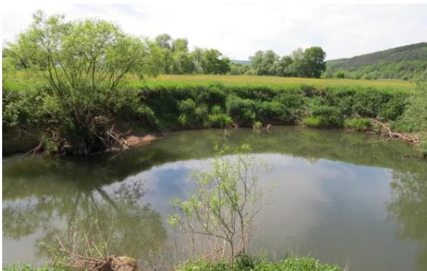
Potentielle Steilwand zugewachsen, Bad-Soden-Salmünster, Kinzig