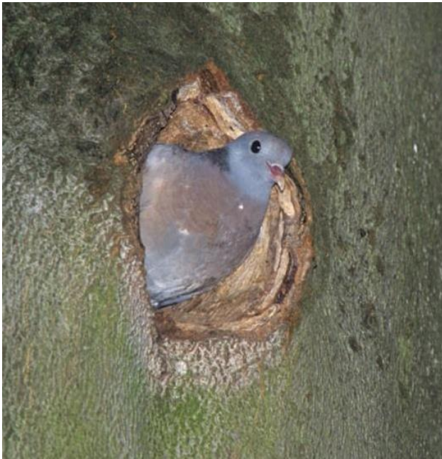
Die Hohltaube brütet in Baumhöhlen und ist in Hessen eng an Schwarzspecht-Vorkommen gebunden

Beispielsweise erreicht sie im Ruhrgebiet durch ein gutes Angebot an künstlichen Nisthilfen eine hohe Dichte. Auch in Hessen waren Bruten abseits der Wälder früher nicht selten, werden heute aber kaum noch beobachtet. Eine Besonderheit stellen Hohltauben dar, die an der Küste in Kaninchenbauten brüten. In Hessen wurde eine Bodenhöhlenbrut im Tagebau Gombeth nachgewiesen.