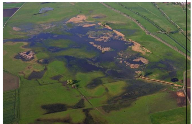
Optimallebensraum NSG Bingenheimer Ried