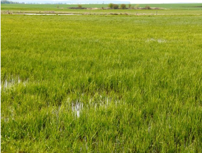
Seggenried im NSG Kist von Berstadt

Maßnahmen sollten in eine flächige Extensivierung der Grünlandnutzung mit später Mahd, Verzicht auf Düngung oder Ausbringung von Gülle und auch einen Verzicht auf Pestizide im Umfeld eingebunden sein.