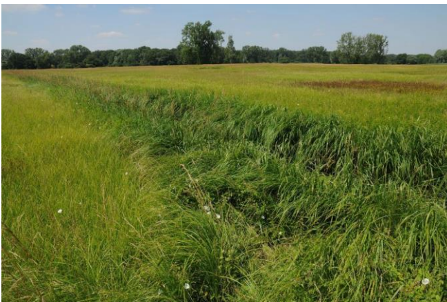
Feuchtgrünland mit Seggen und Süßgrasbeständen, flach überflutet im NSG Bruchwiesen von Büttelborn

Bearbeiter: Stefan Stübing (BFF) , Gerd Bauschmann (VSW)