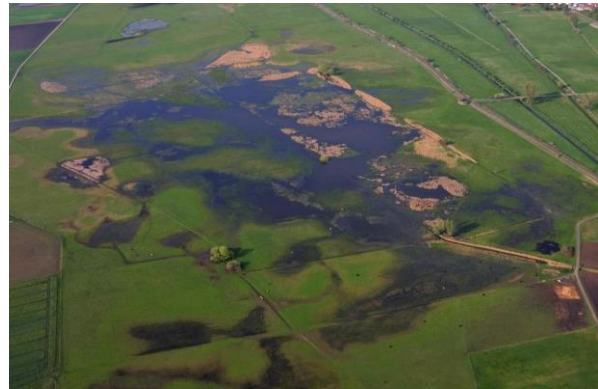
Optimallebensraum NSG Bingenheimer Ried

Als Durchzügler ist die Art neben den genannten Lebensräumen auch oft auf Schlammflächen von Still- und Fließgewässern, Schlammteichen, Materialentnahmestellen und auf feuchten Ackerflächen anzutreffen. Sowohl Brutvögel als auch Durchzügler nutzen die genannten Biotope unabhängig von deren Höhenlage, während die spärlichen Wintergäste und Überwinterer vor allem in den Ebenen zu finden sind.