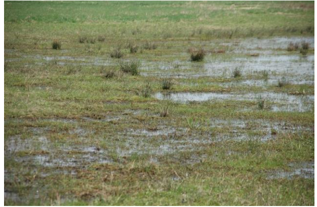
Detailansicht eines Optimallebensraums im Vorfrühling (Ende März)

Maßnahmen sollten in eine flächige Extensivierung der Grünlandnutzung mit später Mahd, Verzicht auf Düngung oder Ausbringung von Gülle und auch einen Verzicht auf Pestizide im Umfeld eingebunden sein.