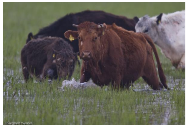
Rinder im Pflegeeinsatz im NSG Bingenheimer Ried