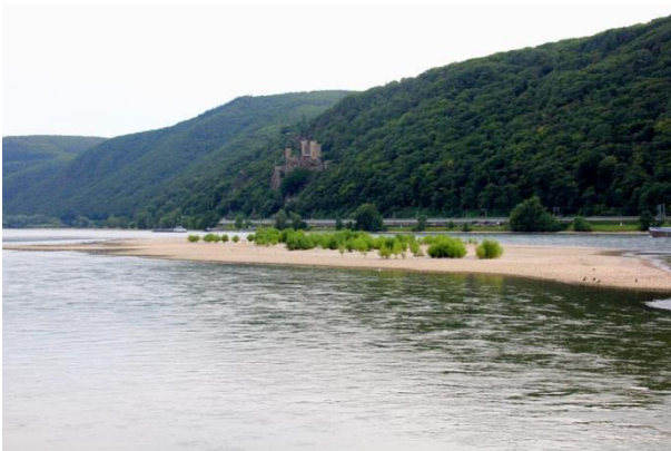
Kiesinsel im Mittelrhein bei Lorch, ein natürlicher Lebensraum des Flussregenpfeifers.

Die Art ist ursprünglich ein Bewohner offener dynamischen Auen größerer Flüsse und Ströme, also von Bereichen, in denen jährlich durch Hochwasser Substratumlagerungen stattfinden. Auf den dabei entstehenden, weitgehend vegetationsfreien Kiesbänken und Schotterinseln legt der Flussregenpfeifer sein Nest an und zieht die Jungen groß. Da sein Lebensraum stetigen Veränderungen unterliegt, ist er gezwungen neu entstandene Flächen schnell zu besiedeln.