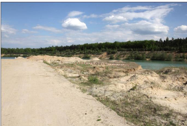
Brutplatz des Flussregenpfeifers in einem Kies-/Sandgrubengelände.

Gleichzeitig nimmt der Störungsdruck in den verbliebenen Bereichen stetig zu.