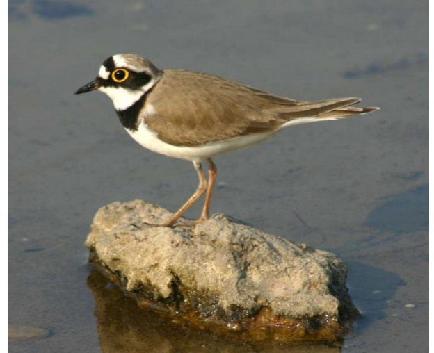
Flussregenpfeifer-Männchen in einem Flachgewässer.

Jedoch wurden natürliche Lebensräume bei uns durch die Begradigungen und Flussregulierungen beginnend im 18. Jahrhundert bis weit in das 20. Jahrhundert hinein weitgehend vernichtet.